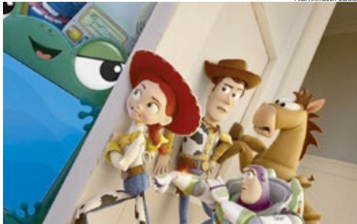
Woody, Buzz Lightyear e Jessie retornam em Toy Story 5, que coloca os

Outra estreia de destaque é A Morte de Robin Hood, releitura mais madura e melancólica do lendário herói inglês. Interpretado por Hugh Jackman, Robin Hood surge marcado pelas consequências de suas escolhas e obrigado a confrontar os fantasmas do