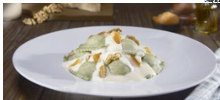
Restaurantes participantes criaram menus especiais inspirados nos 170 anos de Ribeirão Preto