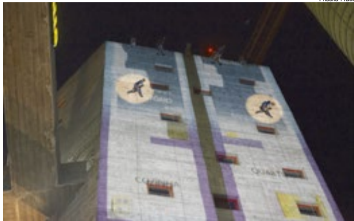
Artistas da Cia VEDA desafiando a gravidade em Correnteza, espetáculo

Inspirado nos fluxos da água, da vida humana e das grandes metrópoles, o espetáculo propõe uma reflexão sobre os movimentos que atravessam o cotidiano. Utilizando a verticalidade da arquitetura como elemento cênico, os artistas criam a sensação de corpos em queda contínua, enquanto projeções em videomapping acompanham as coreogra-