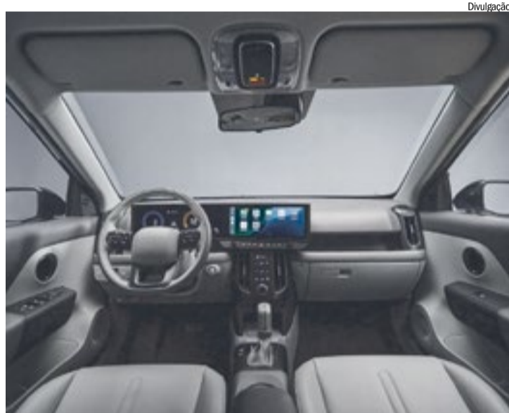
Interior entrega de tecnologia e praticidade ao motorista