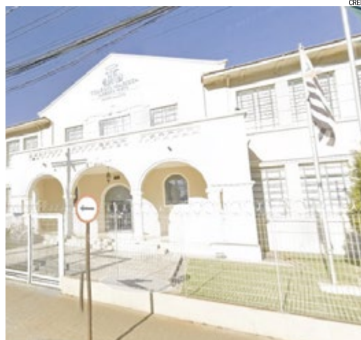
Colégio Marista, na região central de Ribeirão Preto