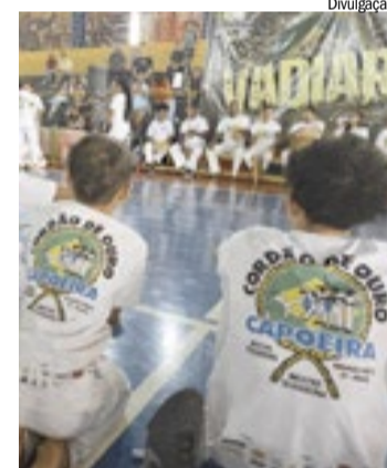
Workshops gratuitos valorizam a capoeira e outras expressões da cultura afro-brasileira