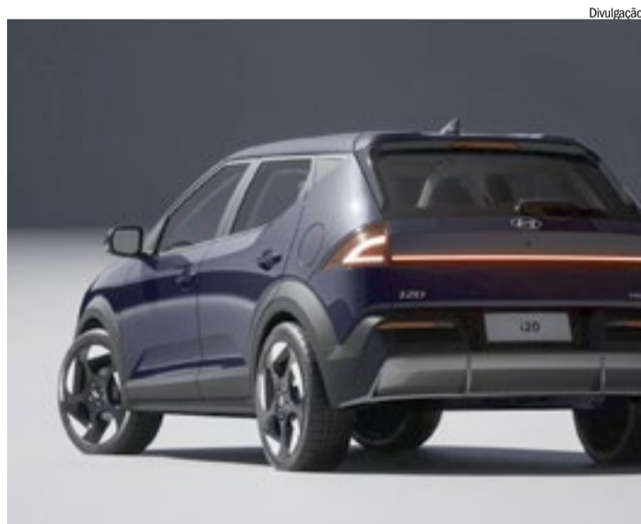
Nova linguagem de design é inspirada nos cortes retos

tena tipo barbatana, coluna C elevada, ângulo marcado entre teto e coluna A, e linha de cintura alta com declividade acentuada a partir da coluna C, compõem o apelo esportivo do modelo.