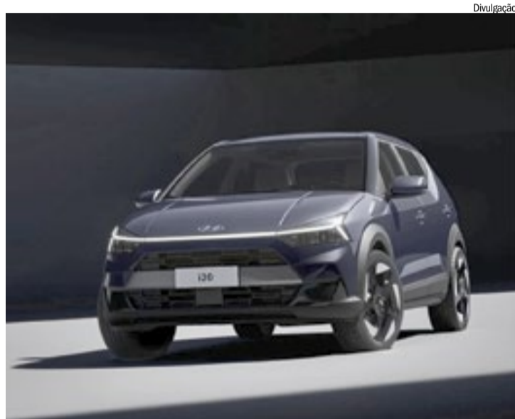
Modelo vai ocupar espaço no mercado entre HB20 e CRETA

Rodas de 17 polegadas com design exclusivo, retrovisores com rebatimento automático, grade frontal em preto brilhante e com faixa central em cinza metalizado, novas molduras nas laterais e arcos de roda proeminentes, protetor do para choque traseiro tridimensional, an-