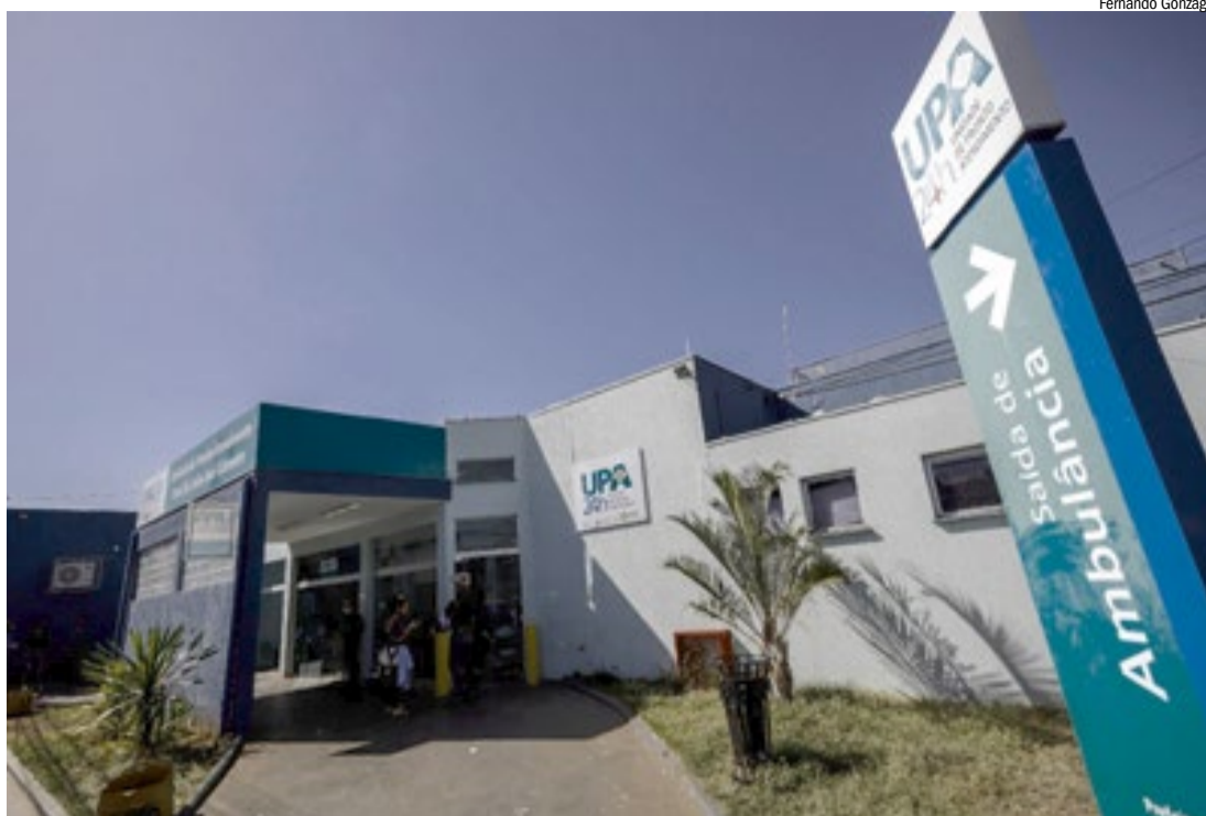
UPA Oeste, na rua Cuiabá, é uma das cinco unidades de pronto atendimento da cidade

Completam a lista dos dez municípios com mais pacientes atendidos na rede de urgência de Ribeirão Preto: Sertãozinho (101), São Paulo (84), Barrinha (83), Cravinhos (69), Pontal (61), Brodowski (61), Batatais (57) e Pradópolis (54).