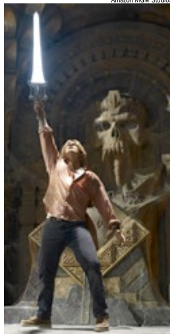
Nicholas Galitzine dá vida à He-Man em Mestres do Universo, produção que aposta na nostalgia para apresentar uma nova versão do herói

Já para o público mais jovem, The Amazing Digital Circus: O Último Ato leva às telonas o desfecho da popular animação surgida na internet. O longa acompanha Pomni e seus companheiros em uma última tentativa de escapar do universo virtual controlado pela inteligência artificial Caine, em uma aventura que mistura fantasia, mistério e reflexões sobre identidade.