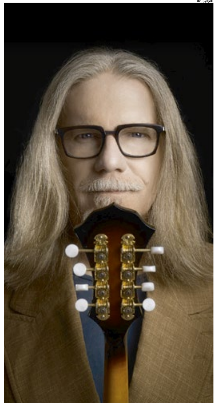
Gessinger completou 40 anos de estrada em janeiro de 2025

Apresentação: 14/06/2026 Local: Multiplan Hall Ribeirão Shopping Abertura da casa: 18h00 Horário do Show: 20h00 Endereço: Av. Cel. Fernando Ferreira Leite, 1540 - Jardim Nova Aliança Ingressos: Ticket Master e bilheteria do Multiplan Hall