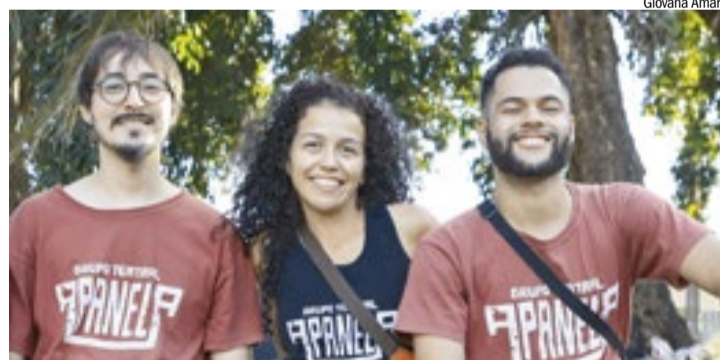
Grupo Teatral ApanelA aposta na interação com o público