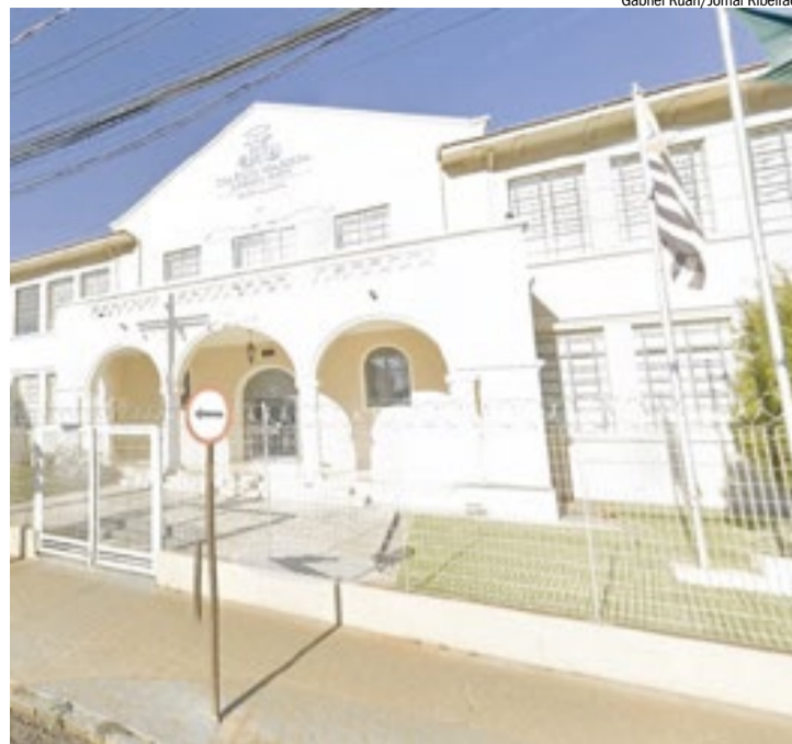
Atual sede do Marista, na Rua Bernardino de Campos: troca reapresentada

Em nota, a assessoria de imprensa da rede Marista afirmou que vai acompanhar a tramitação da proposta. “O Marista reafirma seu compromisso histórico com a educação de qualidade em Ribeirão Preto e seguirá conduzindo qualquer decisão com responsabilidade, transparência e respeito à comunidade educativa”, diz o texto.