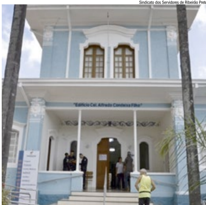
Fachada do Sassom, em Ribeirão: volta aos quadros pode ser liberada

O projeto tramita nas comissões fixas da Câmara e ainda não tem data prevista para votação em plenário.