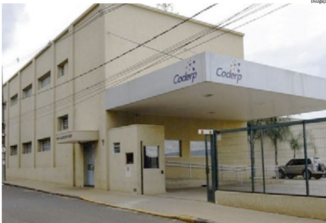
Sede da Coderp, na área Central de Ribeirão Preto, chegou a ser penhorada para pagar dívidas

O processo, porém, não avançou no ritmo inicialmente previsto. Em 2022, a própria Prefeitura informou que a extinção seria gradual e poderia levar de dois a seis anos, a depender do pagamento das dívidas tributárias e da transferência dos serviços para outros prestadores ou para a própria es-