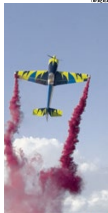
5º Encontro RTM de Miniaturas reúne miniaturas, pistas cenográficas e expositores de diversas regiões do país

O Santa Maria Outlet recebe, de 4 a 7 de junho, o 5º Encontro RTM de Miniaturas, considerado um dos principais eventos do segmento no interior paulista. A programação gratuita reunirá cerca de 140 expositores e hobbystas de diversas regiões do país, com caminhões, máquinas, aeromodelos, ferromodelismo, crawlers e coleções de Hot Wheels. Além da exposição, o público poderá acompanhar demonstrações e miniaturas em funcionamento, em uma atração voltada para colecionadores, famílias e apaixonados pelo universo do modelismo.