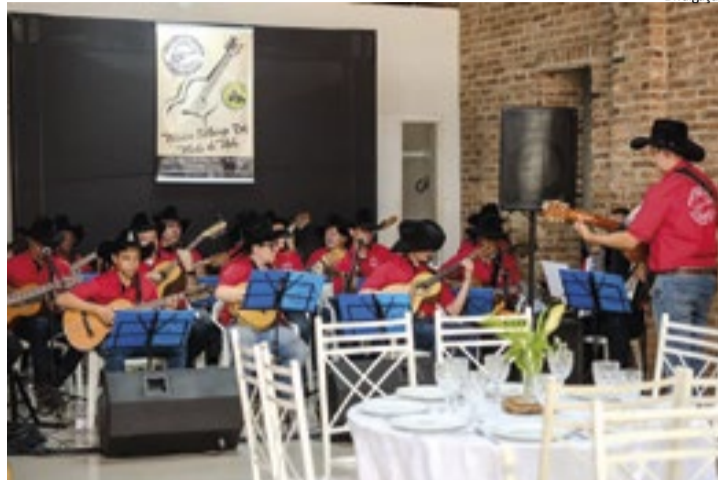
Orquestra de Violeiros de São Carlos abre a programação do Arraiá Mió Di Bão no Novo Shopping