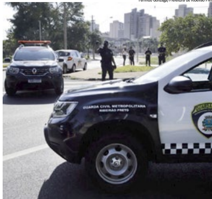
Viaturas da Guarda Civil Municipal de Ribeirão Preto em patrulhamento

Segundo a pasta, entre abril de 2025 e março de 2026 a taxa regional foi de 5,23 homicídios dolosos por 100 mil habitantes, o que representaria redução de cerca de 66% em relação ao início da série histórica, em 2001.