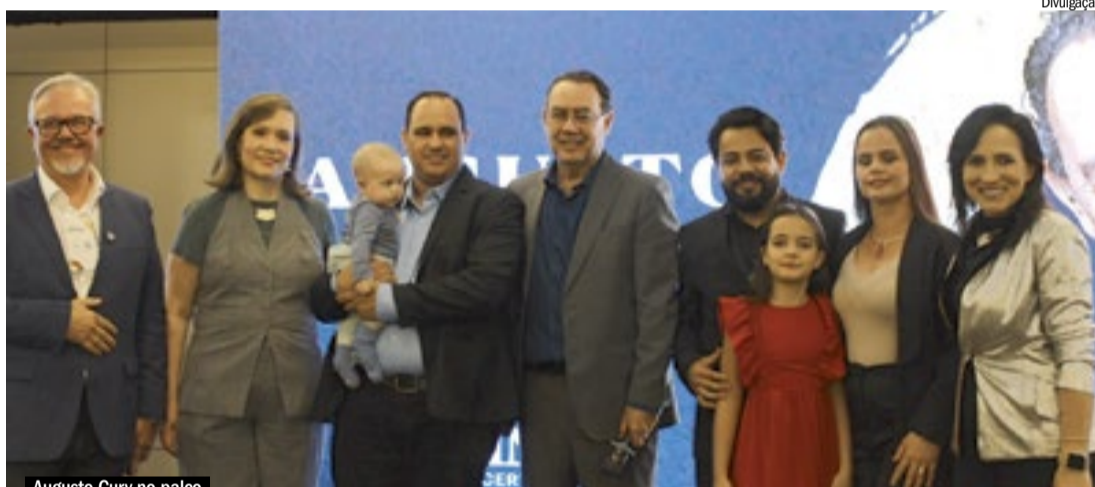
Augusto Cury no palco