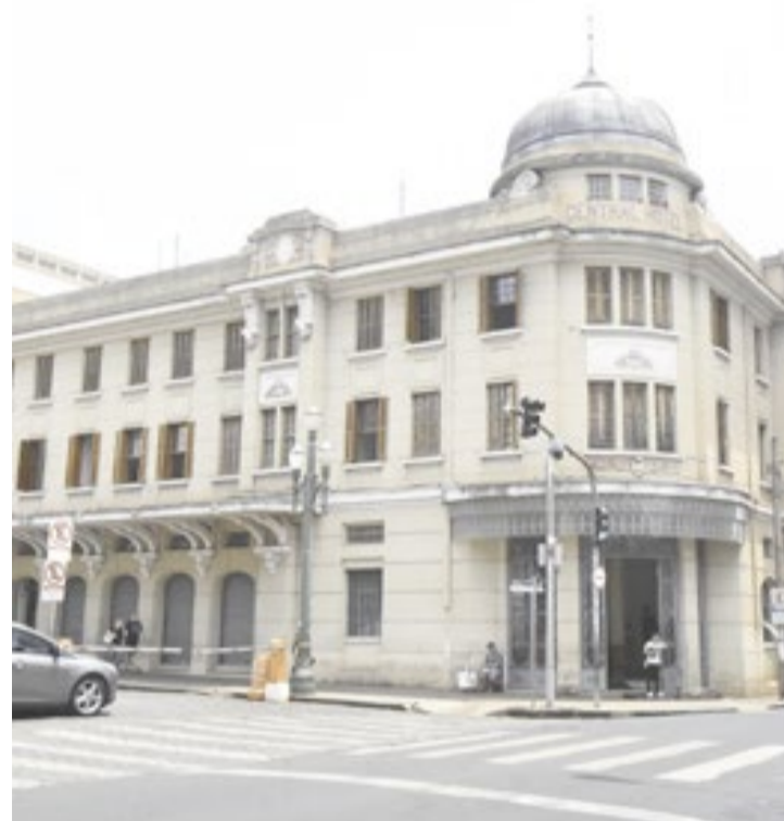
Centro Cultural Palace deve ser gerido pela Associação Maori

ONGs que firmam parcerias com o Poder Público não podem receber salários dessas entidades.