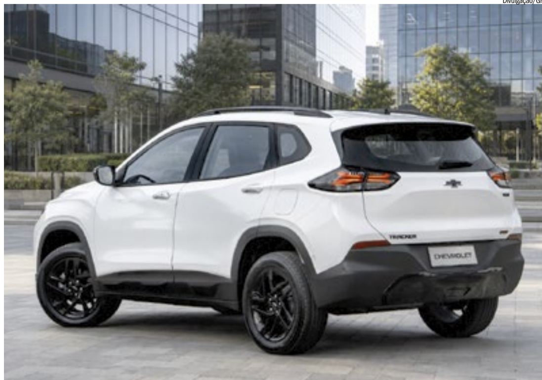
Modelo é o maior e mais sofisticado da Chevrolet na categoria

Outra atualização importante está na conectividade. Toda a linha passa a oferecer oito anos de gratuidade no plano OnStar Basics, que inclui diagnóstico remoto e acesso ao myChevrolet App com funcionalidades como localização do veículo, travamento e destravamento remoto das portas e, nas versões mais sofisticadas, acio-