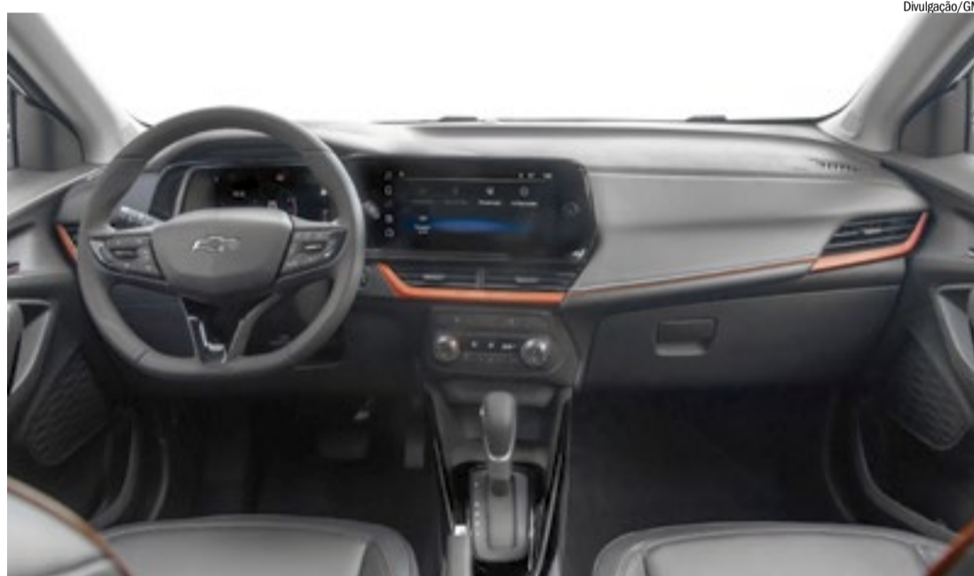
Tracker é oferecido em cinco versões de acabamento e com mais itens no pacote de segurança

namento remoto do motor para pré-climatizar a cabine.