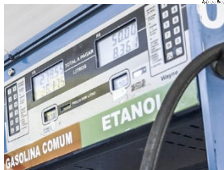
Safra da cana-de-açúcar começa a influenciar o preço nas bombas

Preto, o comportamento dos preços já era esperado. Ele avalia que o mercado deve caminhar agora para uma fase de estabilização, ainda com possibilidade de novas quedas, mas em ritmo mais moderado até o fim da colheita. Nos postos da cidade, a baixa já chega a algo entre 20 e 30 centavos no etanol e na gasolina, com recuo de 20 a 25 centavos no diesel. Outro fator que pode sustentar o movimento é o aumento da mistura de etanol anidro na gasolina, que deve passar de 30% para 32%.