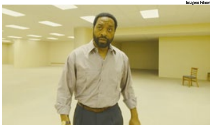
Chiwetel Ejiofor protagoniza Backrooms: Um Não-Lugar , filme que cria uma atmosfera claustrofóbica e perturbadora

Outro destaque é A Revolução dos Bichos , nova adaptação da clássica obra de George Orwell dirigida por Andy Serkis. A animação revisita a história dos animais que assumem o controle de uma fazenda em busca de igualdade, mas acabam mergulhando