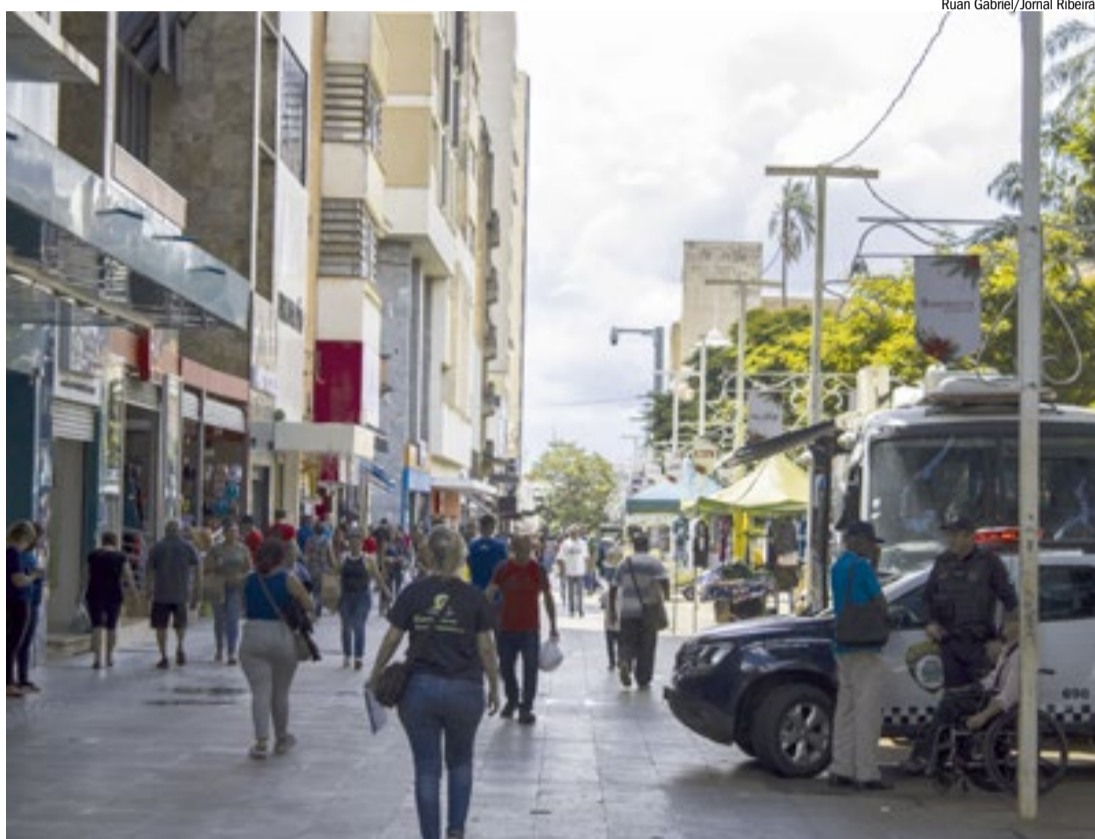
Movimento no comércio no calçadão da área central em Ribeirão: setor é um dos que oferecem vaga no mutirão

4º Emprega Mais Ribeirão de 2026 Data: 29 de maio de 2026 Local: Parque Tom Jobim – Rua Cel. Américo Batista, Jardim Procópio