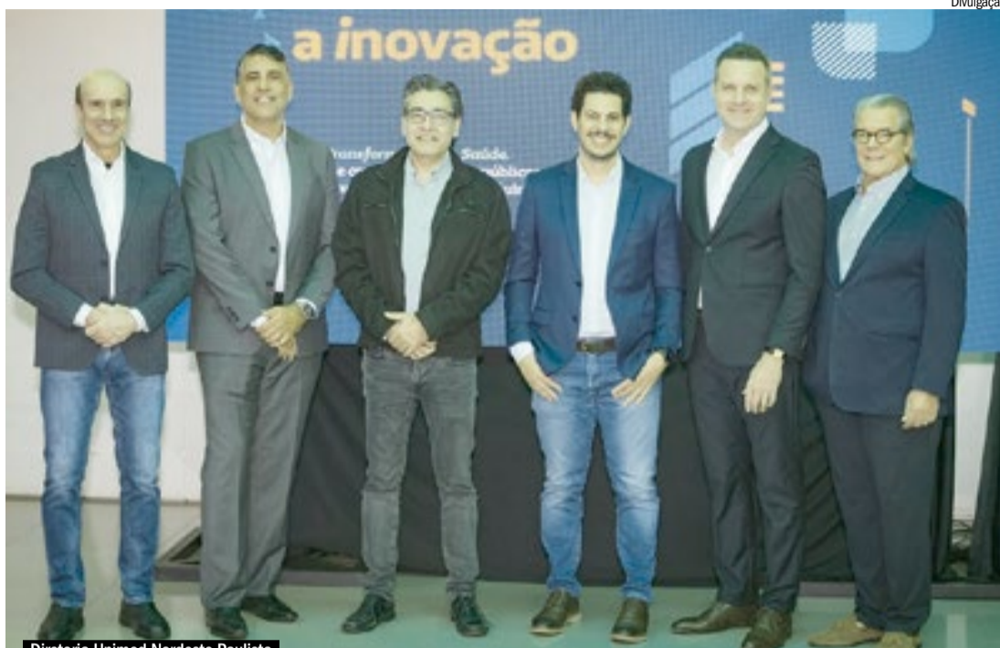
Diretoria Unimed Nordeste Paulista

A coluna registra a inauguração da nova sede da Secretaria da Cidadania, Pessoa com Deficiência e Inclusão Social, realizada no dia 22 de maio, no Centro de Ribeirão Preto. O novo espaço representa um importante avanço no acolhimento e no fortalecimento das políticas de inclusão na cidade, reunindo autoridades e convidados em torno de uma causa que merece sempre destaque e atenção.