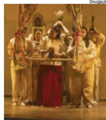
Orquestra de Violeiros de São Carlos abre a programação do Arraiá Mió Di Bão no Novo Shopping

A Mostra de Teatro da Alma apresenta neste domingo (31), às 16h, o espetáculo “Morte e Vida Severina”, no Teatro Auxiliadora. Inspirada na obra clássica de João Cabral de Melo Neto, a montagem do grupo profissionalizante da Academia Livre de Música e Artes de Ribeirão Preto revisita a trajetória do retirante nordestino em uma encenação marcada pela estética expressionista, pela força da palavra poética e pela expressividade corporal do elenco. A apresentação tem entrada gratuita, com retirada de ingressos uma hora antes do início.