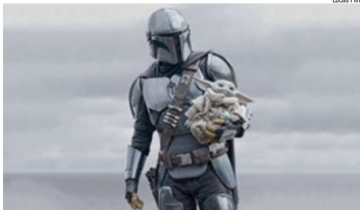
Pedro Pascal retorna como Din Djarin ao lado de Grogu em novo filme do universo Star Wars , que estreia nesta semana nos cinemas

Entre os destaques da semana também está o nacional Love Kills , dirigido por Luiza Shelling Tubaldini. Ambientado na Cracolândia, em São Paulo, o longa mistura romance, suspense e terror ao contar a história de uma vampira que tenta controlar sua sede de sangue enquanto vive um rela-