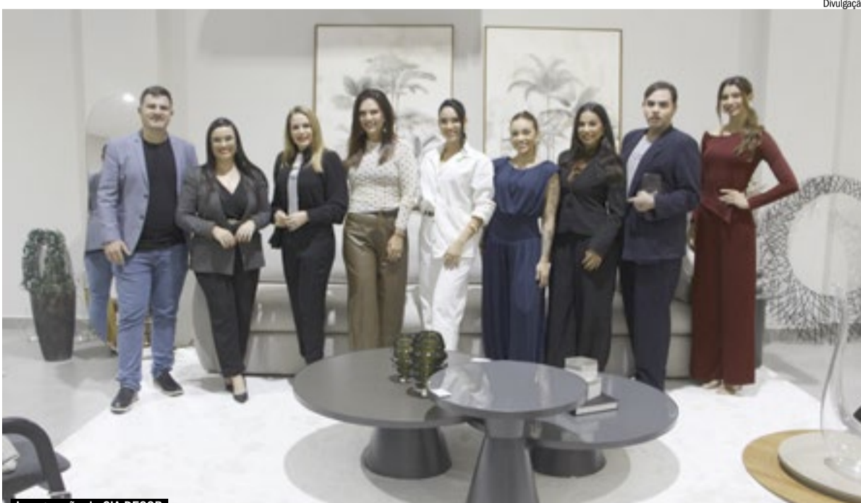
Inauguração da CIA DECOR