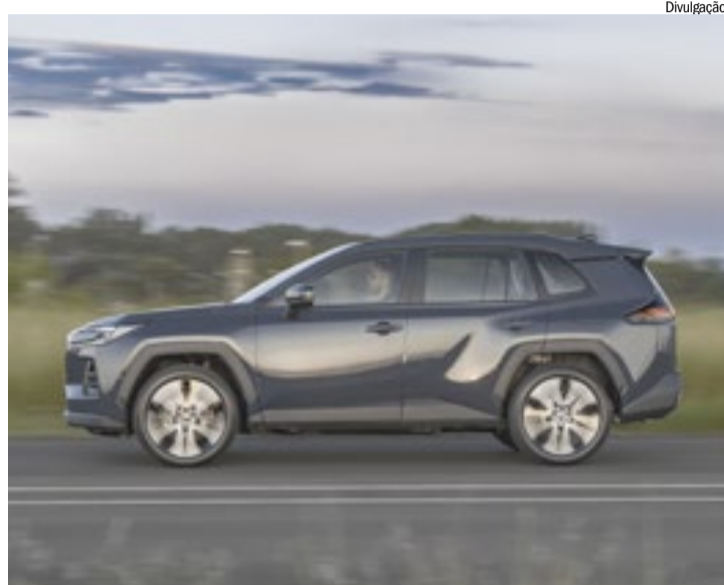
Nova geração estreia identidade visual da marca e traz novos recursos

O modelo passa a utilizar a quinta geração do sistema híbrido full da Toyota, composto por um motor 2.5 litros de quatro cilindros que atua em conjunto com o motor elétrico principal (MG2) por meio de uma transmissão continuamente variável do tipo planetária para garantir respostas rá-