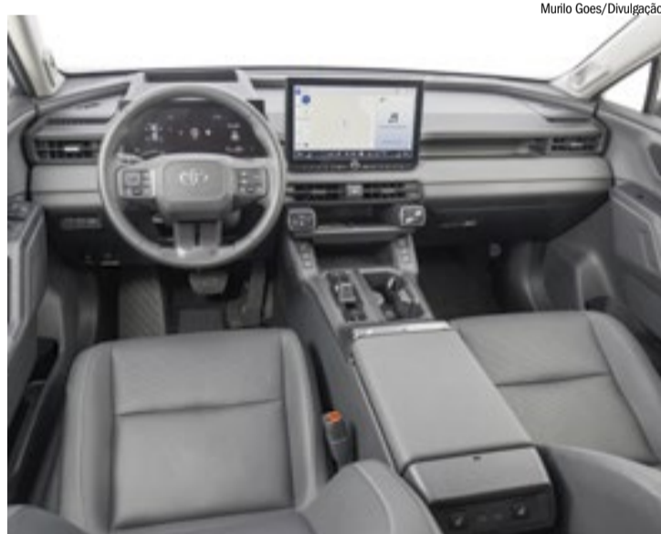
Interior do novo RAV4 prioriza a funcionalidade e tecnologia