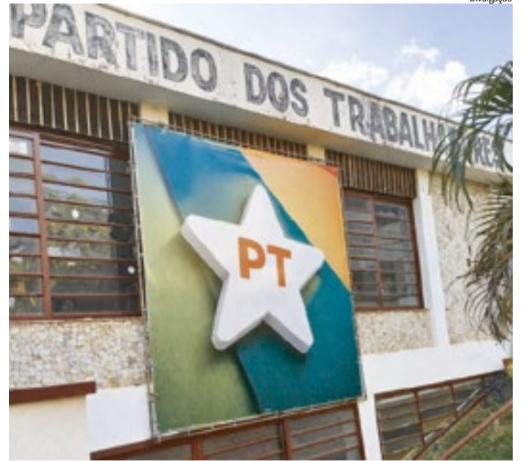
Sede do PT, no Jardim Sumaré, foi atacada com quatro coquetéis Molotov