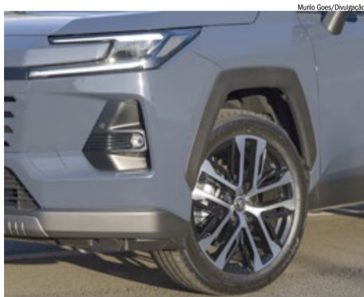
Modelo tem rodas aro 20 em todas as suas versões

pidas e desempenho consistente, enquanto os dois motores elétricos (MG1 e MG2) também contribuem para a recarga da bateria de íons de lítio.