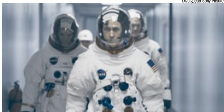
Ryan Gosling em “Devoradores de Estrelas”, ficção científica que acompanha um professor em missão espacial para salvar a humanidade

Outro lançamento é o drama romântico “Uma Segunda Chance”, que acompanha uma ex-detenta em busca de reconstruir a vida e se reco-