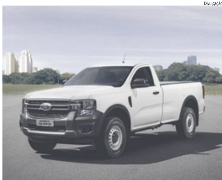
Ranger agora avança também no segmento de picapes para uso comercial

Os novos modelos chegam para ampliar a família de picapes médias, incluindo versões para o trabalho (XL), uso misto (XLS, Black), pessoal (XLT e Limited) e esportivo (Ranger Raptor). Junto com a Transit e o Territory, elas também fazem da Ford Pro a marca de veículos comer-