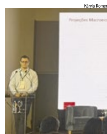
Palestrante durante apresentação no WTC Fórum

Na sequência, painéis temáticos reuniram lideranças da Ouro Fino Saúde Animal,