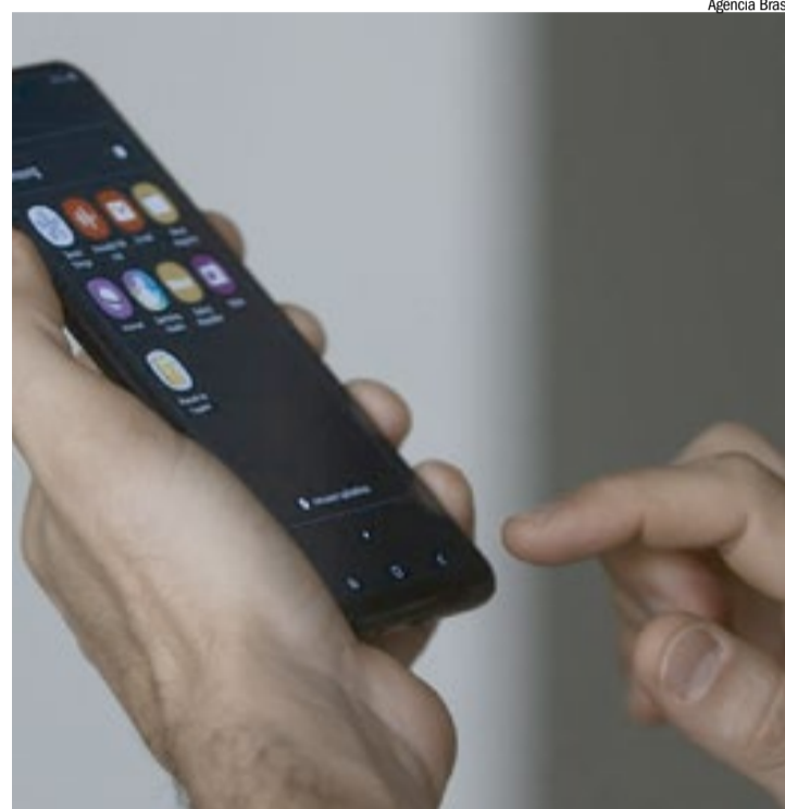
Ligações excessivas para consumidor geraram indenização de R$ 3 mil

A decisão ressalta que a cobrança de dívidas é um direito legítimo das empresas, mas deve respeitar parâmetros legais e não pode expor o consumidor a constrangimentos. No entendimento do tribunal, o problema não está na cobrança em si, mas na forma como ela é realizada. “A reiteração excessiva, sobretudo quando direcionada a quem não é devedor, foi considerada abusiva”, disse.