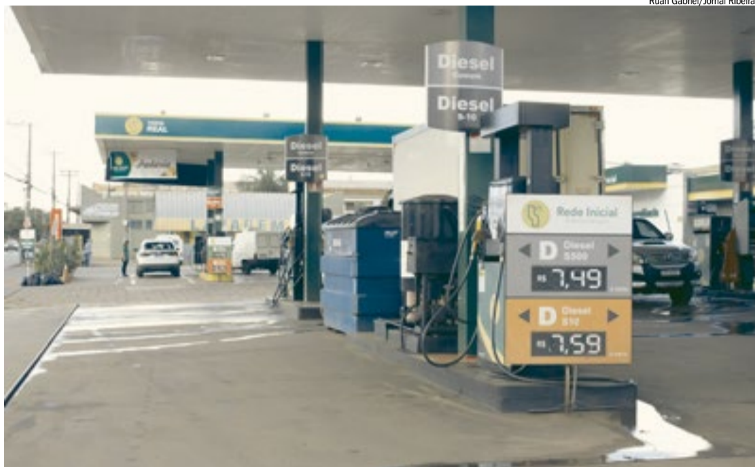
Preço do óleo Diesel subiu praticamente R$ 1 nos postos da região: entidade não descarta falta do produto

Entidade que representa os donos de postos relata dificuldades de abastecimento e demora no impacto das medidas do governo