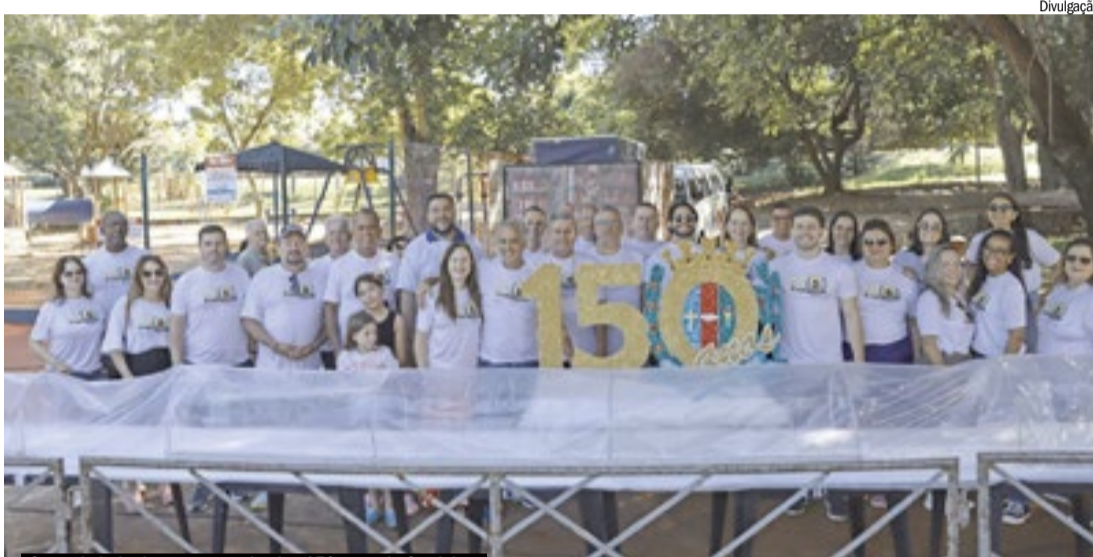
Corte do bolo de comemoração dos 150 anos de Cravinhos

Cravinhos celebrou seus 150 anos com um dia festivo no Parque Ecológico Dr. Renato e Armando Pagano, no domingo, 15 de março. O tradicional bolo, com 150 metros, reuniu cerca de 3.500 pessoas em clima de alegria, com direito a música, diversão e sabores que marcaram a comemoração. A corporação Maestro Pedrinho Amoroso Sobrinho deu o tom da festa, que movimentou a cidade.