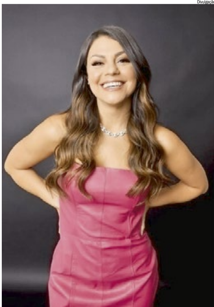
Bruna mergulha em histórias inéditas, situações do cotidiano e reflexões sobre relacionamentos

Em entrevista exclusiva ao Jornal Ribeirão, a comedianta ressaltou o caráter real das histórias contadas por ela no palco, sem deixar de lado o exagero cômico. “Claro que tem uma liberdade poética para dar uma