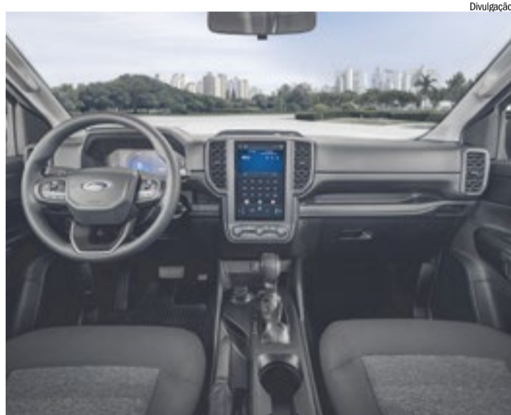
Interior oferece conforto e tecnologia para quem usa