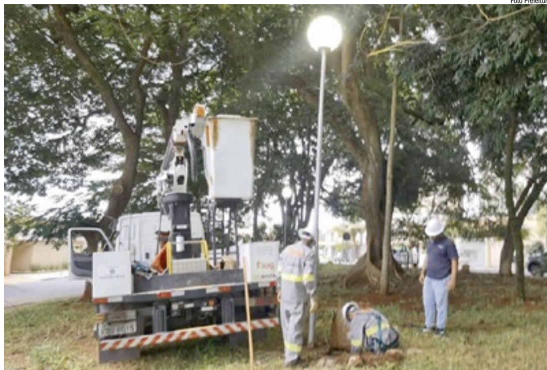
Equipe do Conecta durante reparo em ponto de iluminação: cobranças contra o consórcio se acumulam