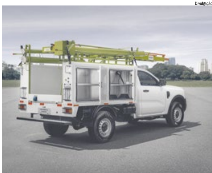
Classificado como VUC, modelo atende diversos tipos de uso

ciais leves com o portfólio mais completo do mercado.