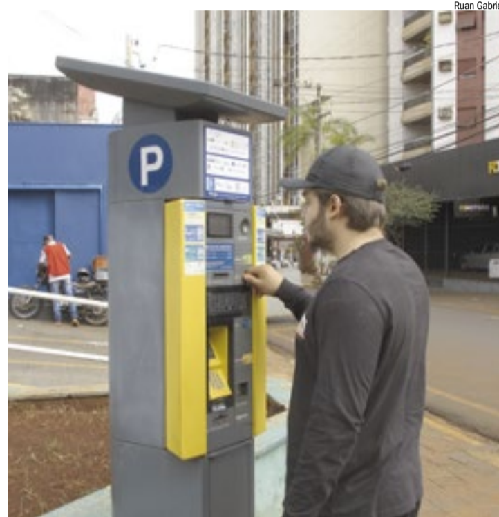
Motorista usa parquímetro no Centro de Ribeirão: conta mais salgada

Procurada, a RP informou por meio de sua assessoria de comunicação que vai recorrer da decisão junto ao Tribunal de Justiça do Estado.