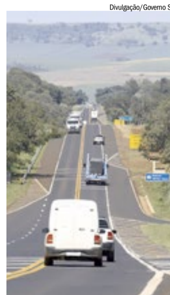
Governo concedeu, de novo, rodovias da região

O projeto integra o programa SP pra Toda Obra, programa do Governo de São Paulo que prevê melhorias em 21,2 mil quilômetros de rodovias administradas pelo DER-SP e pelas concessionárias.