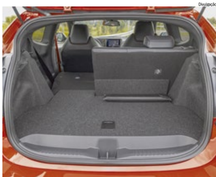
Vista de uma das configurações do porta-malas do novo GR Yaris

Por sua vez, o sistema de tração integral GR-Four, a mesma do GR Corolla, utiliza três diferenciais (central e dois Torsen de deslizamento limitada) e oferece modos Normal (60:40), Gravel (53:47) e Track (que varia entre 60:40 e 30:70) uma tecnologia herdada do rali, onde a GAZOO Racing é