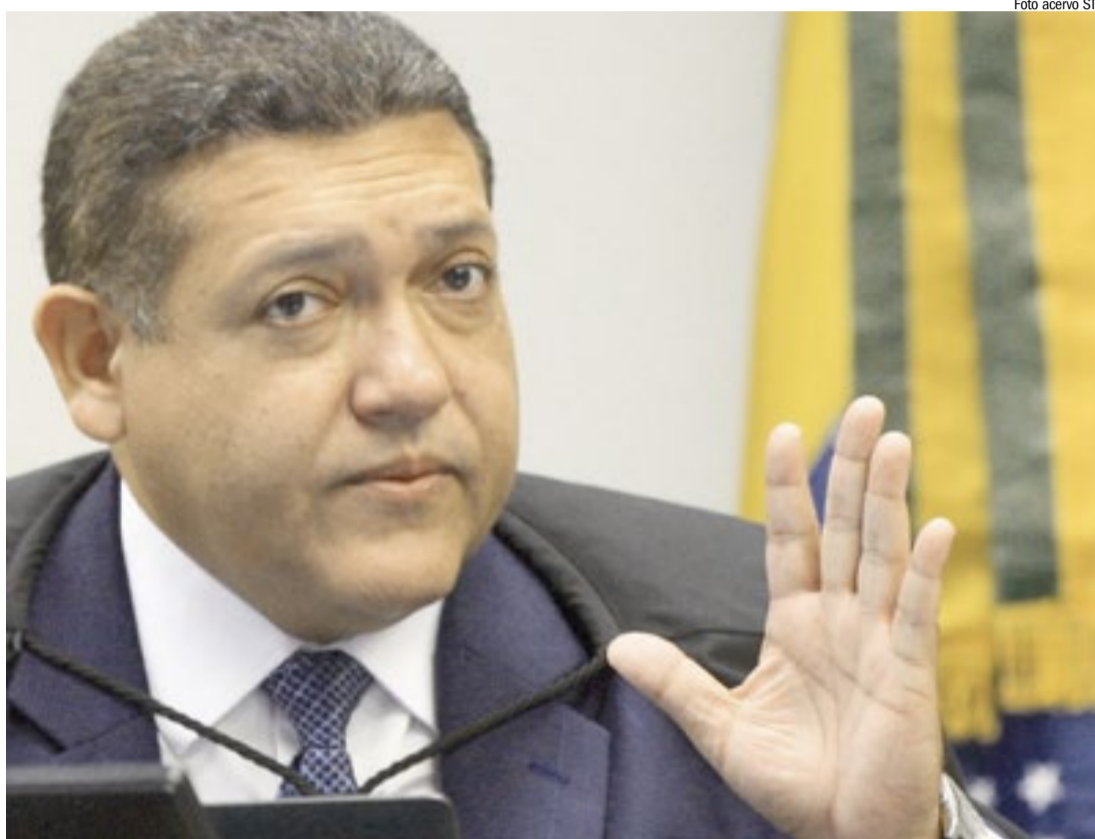
Ministro Kassio Nunes Marques, do STF, é o relator do recurso que pode validar escutas

Agora, o STF decidirá exclusivamente sobre a legalidade das interceptações iniciais. O mérito das acusações não será analisado nesta fase. A Procuradoria-Geral da República manifestou-se a favor do recurso do MPSP.