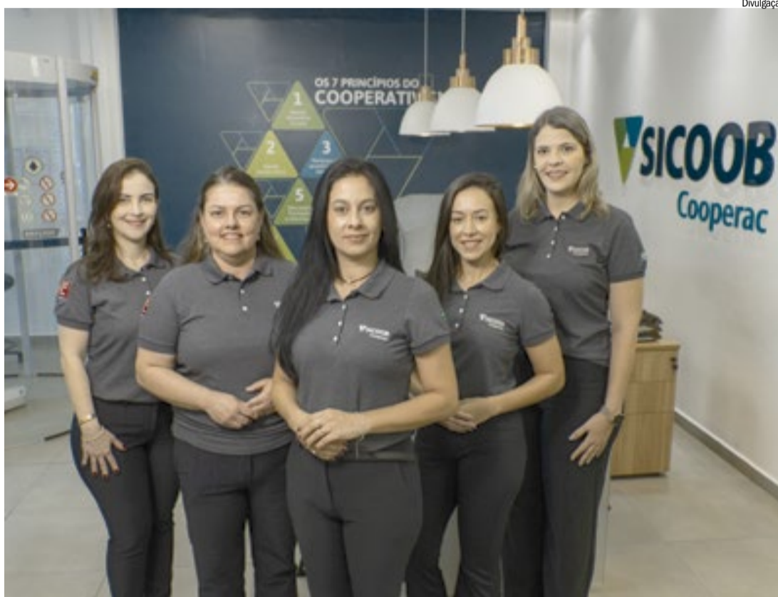
Sicoob Cooperac tem duas agências formadas totalmente por mulheres: investimentos em alta

Pesquisa Datafolha, junto com a Associação Brasileira das Entidades dos Mercados Financeiro e de Capitais (ANBIMA), publicada no Anuário Raio X do Investidor Brasileiro de 2025, aponta que cerca de 33% das mulheres brasileiras são consideradas investidoras, considerando aque-