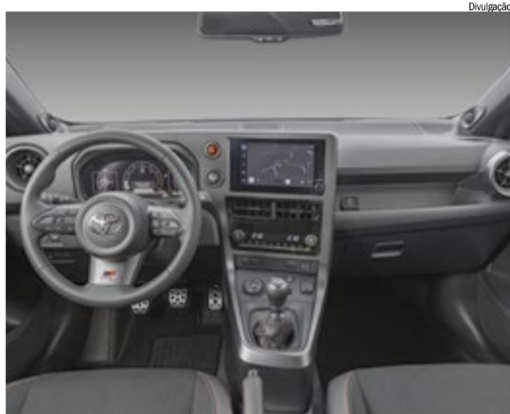
Cabine do novo GR Yaris é exclusiva e segue o conceito driver-first