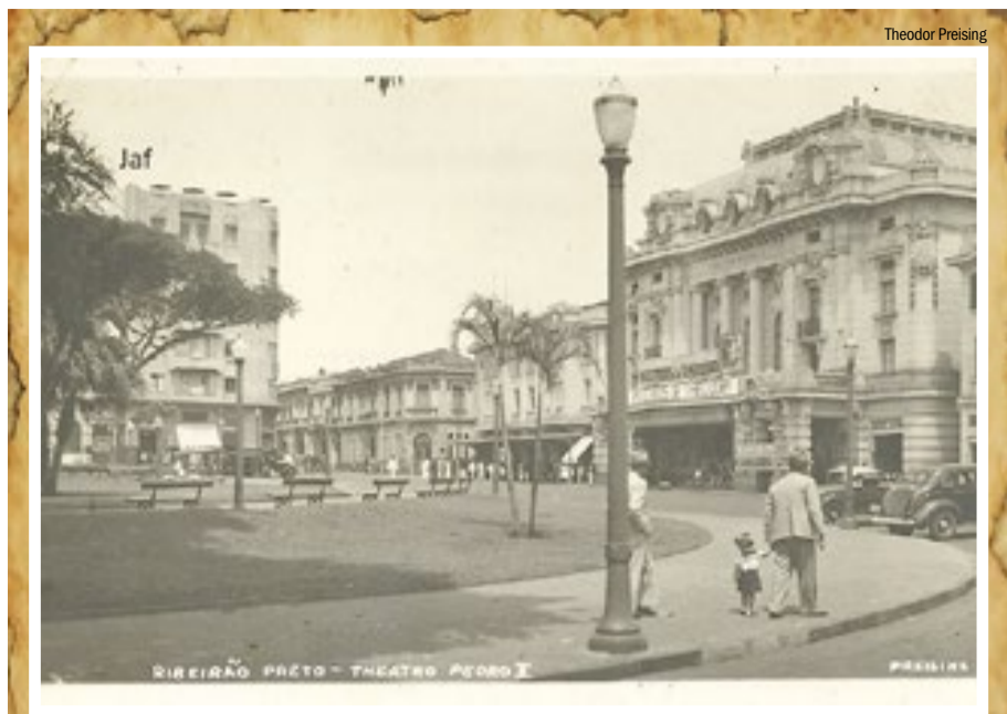
CARTÃO POSTAL - Coração cultural e econômico de Ribeirão, a Praça XV de Novembro, com o Theatro Pedro II, edifício Diederichsen, Palacete Meira Júnior e outras construções na rua Álvares Cabral o fundo, retratadas em foto do fim da década de 1930 pelo alemão Theodor Preising, um dos pioneiros nas fotos artísticas no Brasil.