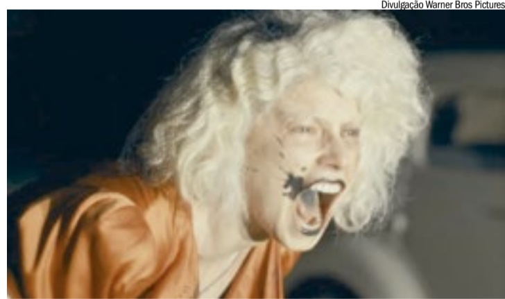
Jessie Buckley interpreta a criatura ressuscitada em A Noiva!

A programação também traz a animação Cara de Um, Focinho de Outro, que acompanha Mabel, uma jovem apaixonada por animais que utiliza uma tecnologia inovadora para transferir sua consciência para o corpo de um castor robó-