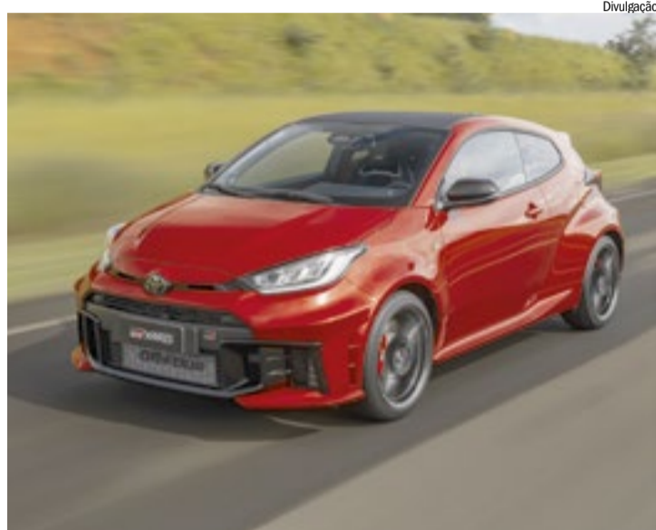
Novidade já está disponível na rede de concessionárias Toyota

Para isso, o propulsor conta com pistões reforçados, injeção direta de combustível D-4ST com pressão elevada para 260 bar, radiador de óleo com sistema de refrigeração aperfeiçoado e um pulverizador de água para o controle de temperatura do intercooler em situações de exigência extrema.