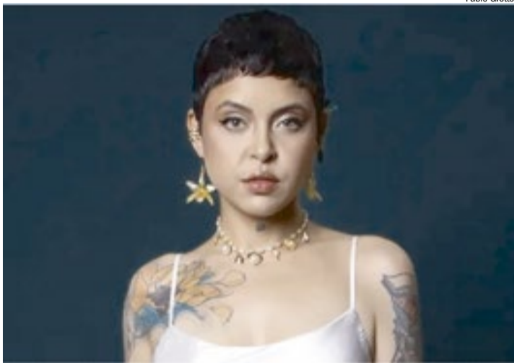
Kell Smith apresenta sucessos como Era Uma Vez e Girassol em show

Reconhecida por hits como Respeita as Mina, Kell Smith soma quase um bilhão de reproduções nas plataformas digitais e se desta-