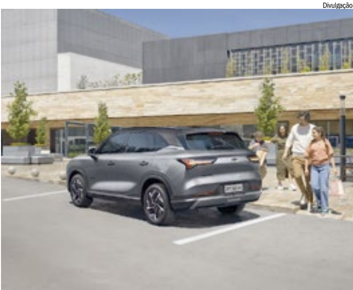
SUV elétrico da Chevrolet oferece porte e pacote avançado de segurança

Pensado para atender diferentes perfis de uso, o Captiva EV conta com uma