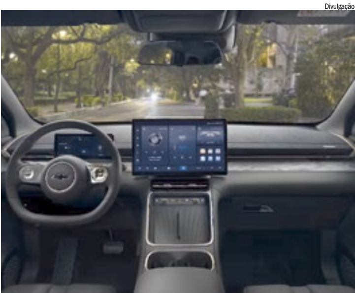
Interior é revestido com materiais selecionados, com superfícies soft-touch