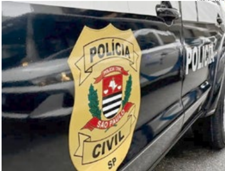
Polícia de São Paulo é a responsável pela investigação

A loja, entretanto, nega irregularidades e afirma que outros clientes consumiram o mesmo produto. A Polícia também analisa imagens de câmeras de segurança e aguarda os laudos para confirmar se houve envenenamento. As investigações continuam.