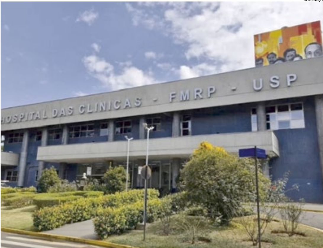
Hospital das Clínicas, unidade da USP, em Ribeirão Preto: Justiça decidiu prorrogar licença-maternidade

Com isso, determinou a prorrogação da licença para 180 dias, contados a partir do início do benefício, com manutenção integral da remuneração.