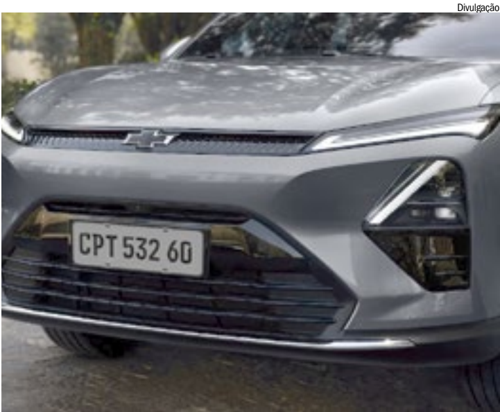
Dianteira chama atenção pelos faróis em LED bem afilados

ampla linha de acessórios originais Chevrolet.