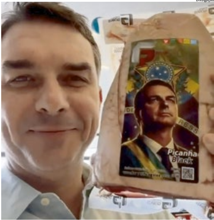
Flávio Bolsonaro, senador pelo Rio de Janeiro, durante evento: acusação

Procurados, representantes de Flávio Bolsonaro não se manifestaram até o fechamento desta edição. Anac e PGR também informaram que não irão comentar o caso neste momento, que corre sob sigredo de Justiça. A apuração segue em andamento e envolve pesquisas da legislação eleitoral, aeronáutica e fiscalizações em eventos de grande porte.