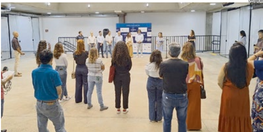
Cerimônia de ‘entrega’ da Casa da Cultura ao Estado, em 2024

“O Estado entraria na segunda fase, com a Organização Social, para implantar os cursos e toda a parte pedagógica e não arcou com o custo das obras, que eram de competência da Prefeitura, responsável pela cessão e adequação do imóvel. Essa etapa foi realizada, mas não atendeu integralmente às condições necessárias para avançar à fase de implantação das atividades culturais e educacionais. Diante disso, a Secretaria rescindiu