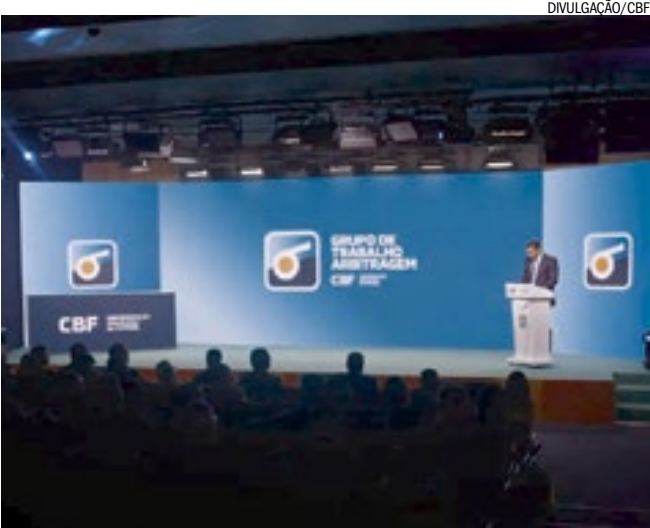
Confederação apresentou proposta para profissionalizar árbitros

A Confederação Brasileira de Futebol (CBF) anunciou nesta terça-feira (27) o primeiro modelo de profissionalização da arbitragem nacional em sua história. O projeto prevê a contratação, por temporada, de equipes fixas para atuar nas partidas do Brasileirão da Série A ao longo do ano, marcando uma mudança estrutural no vínculo entre árbitros e a entidade. Ao todo, 72 árbitros serão contratados: 20 árbitros centrais (11 do quadro da FIFA), 40 assistentes (20 da FIFA) e 12 árbitros de vídeo (VAR), todos credenciados pela entidade internacional.