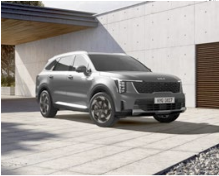
Novo Sorento 4x4 é equipado com o motor 2.2 litros, Smartstream, diesel