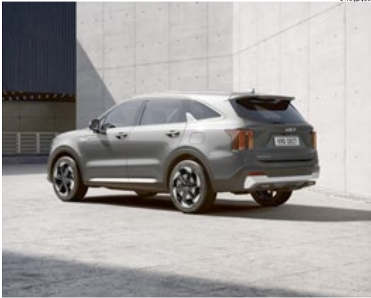
Modelo apresenta proporções que reforçam sua presença