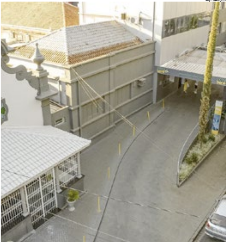
Fachada do Hospital Beneficência Portuguesa: sem novos pacientes

dade da pessoa humana, no que tange à prestação do serviço público de saúde”, diz um trecho da decisão. Em nota, a diretoria do hospital afirmou que trabalha na resolução dos problemas apontados pelo MP. “A instituição mantém diálogo permanente com a Secretaria da Saúde e está estruturando um plano conjunto para assegurar a continuidade da assistência aos usuários do SUS. Os demais serviços do hospital seguem funcionando normalmente, incluindo internações, cirurgias, atendimentos ambulatoriais, convênios e particulares”, diz o texto. Já a Secretaria municipal de Saúde informou que trabalha na reorganização da rede.