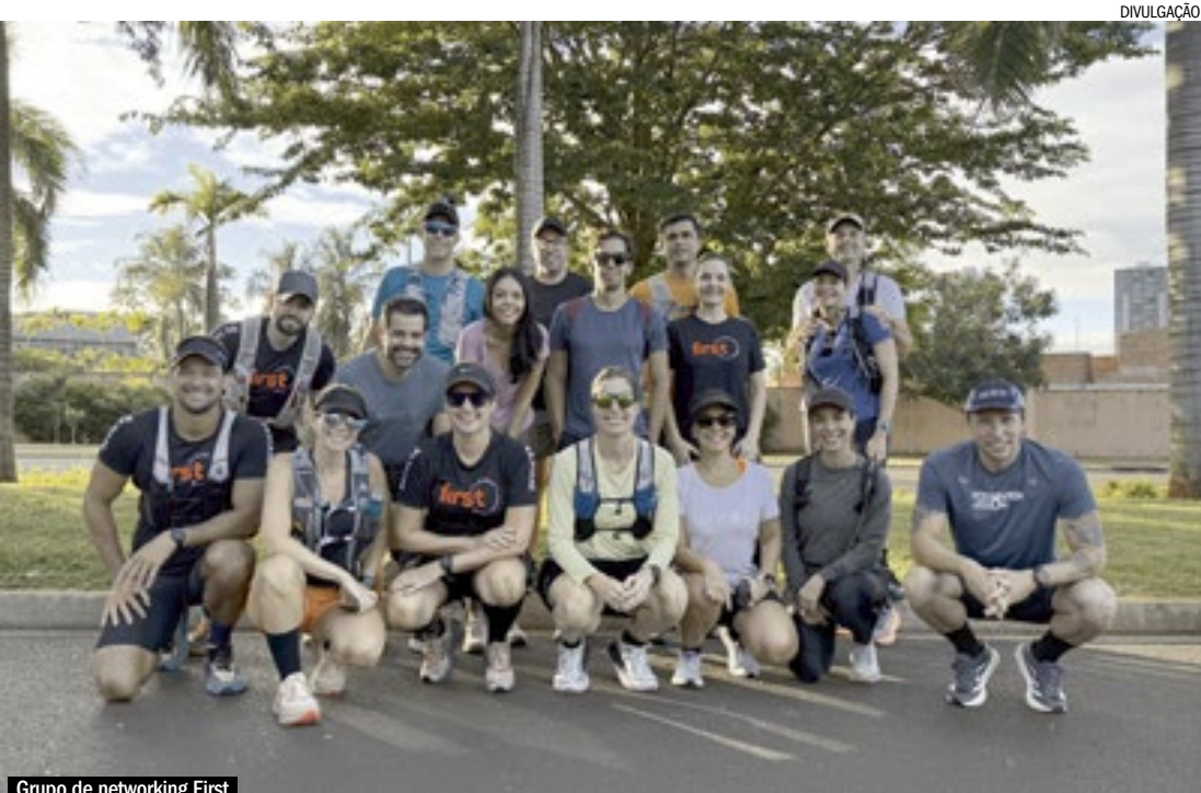
Grupo de networking First