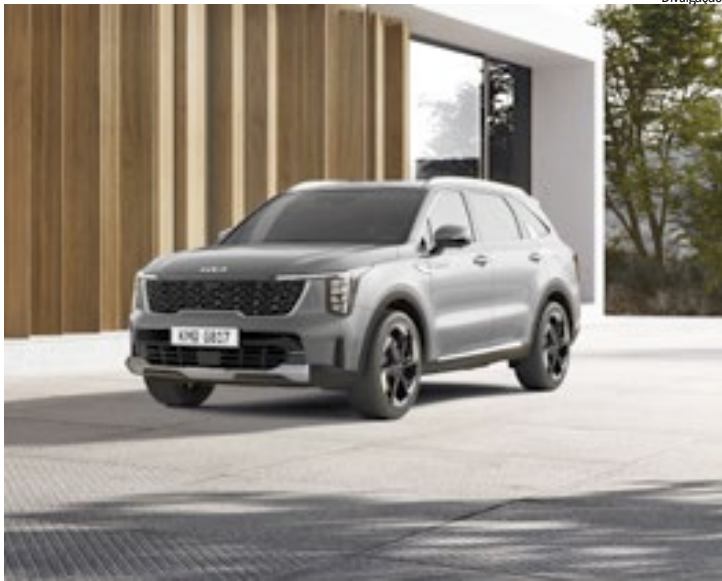
Lançamento oficial ao público será no Rio Open ATP 500

O design do novo Sorento 4x4 traduz a filosofia global “Opostos Unidos” (Opposites United), que combina força e modernidade em proporções equilibradas. A dianteira adota faróis verticais em LED com assinatura luminosa Star Map, inspirada nas constelações estelares e presente nos SUVs elétricos da Kia, além de grade tridimensional com acabamento escurecido e o logotipo da marca posicionado