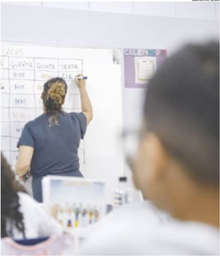
Professora em sala de aula: artes e inglês perdem espaço na grade

Ao julgar a ação, o TJ-SP considerou que as leis criaram hipóteses excessivamente amplas para contratações temporárias, o que viola a Constituição Federal, que estabelece o concurso público como regra e restringe contratações temporárias a situações estritamente excepcionais.