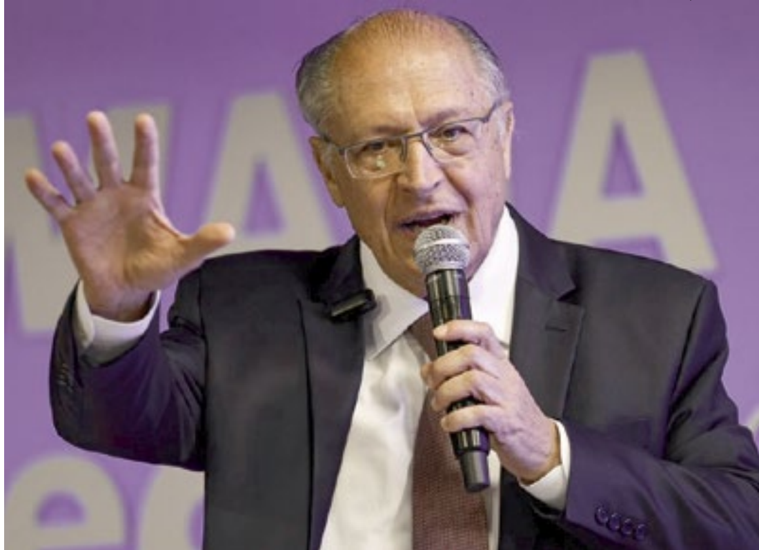
Geraldo Alckmin, vice-presidente da República, durante evento em Ribeirão Preto