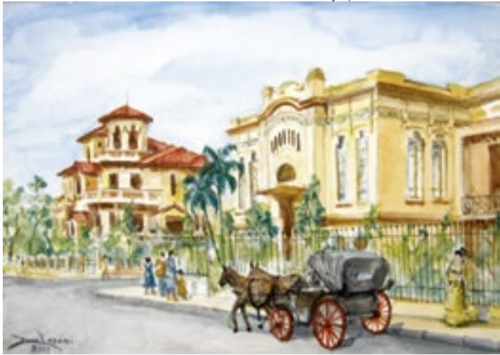
Obra do artista Ary de Lázari que integra a mostra Silêncio Involuntário

A exposição propõe uma reflexão sobre diferentes formas de silêncio — impostos ou vividos — no pla-