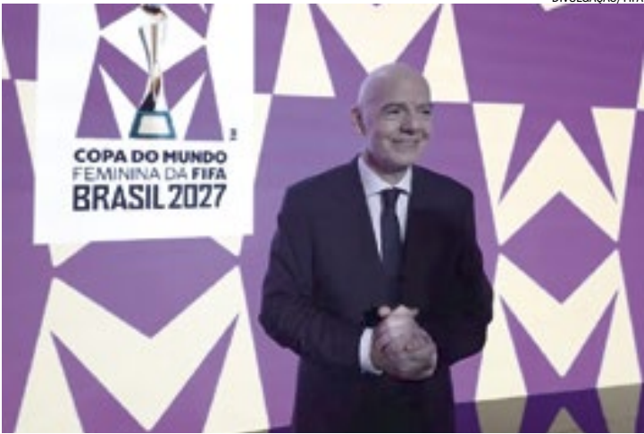
Gianni Infantino, presidente da Fifa, ao lado da marca oficial do evento

O evento foi conduzido pelo presidente da Fifa, Gianni Infantino, e reuniu autoridades do esporte, len-