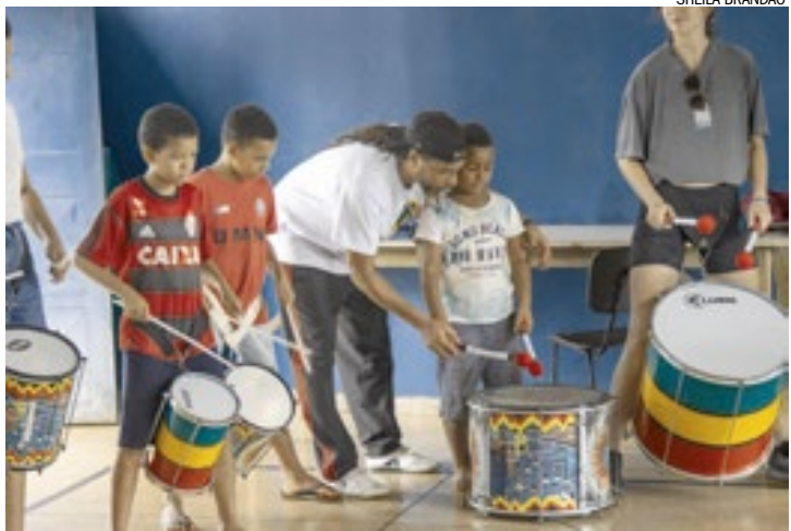
Oficinas Saberes e Significados da Percussão Afro-Brasileira