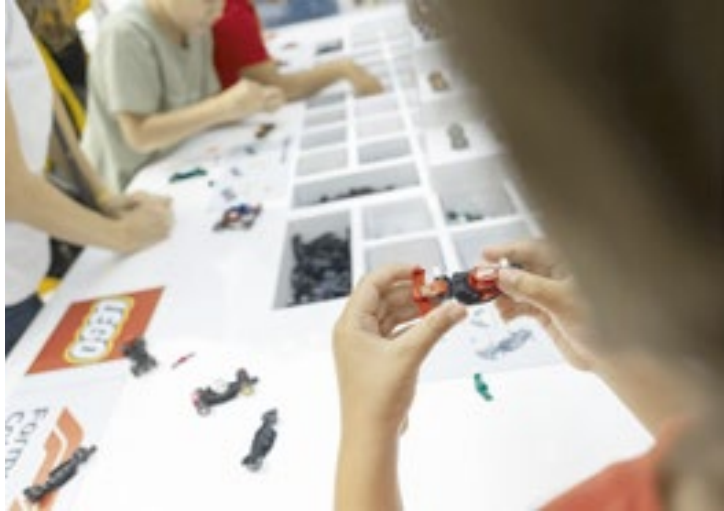
Experiência LEGO® Fórmula 1® Collection