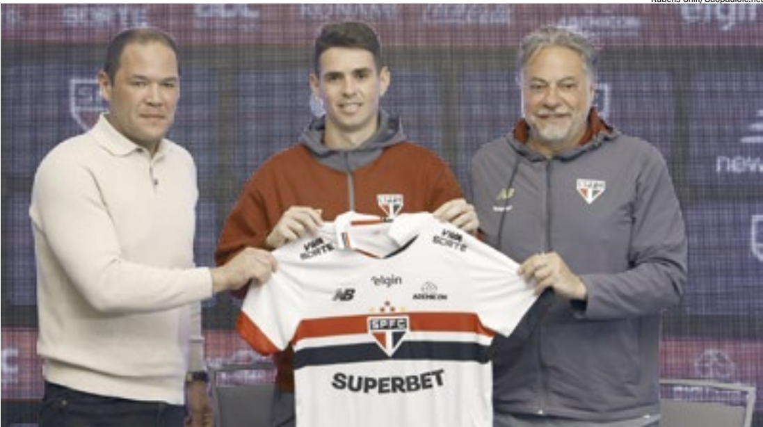
Presidente Julio Casares (à direita) já foi afastado e deve perder o cargo, se não renunciar