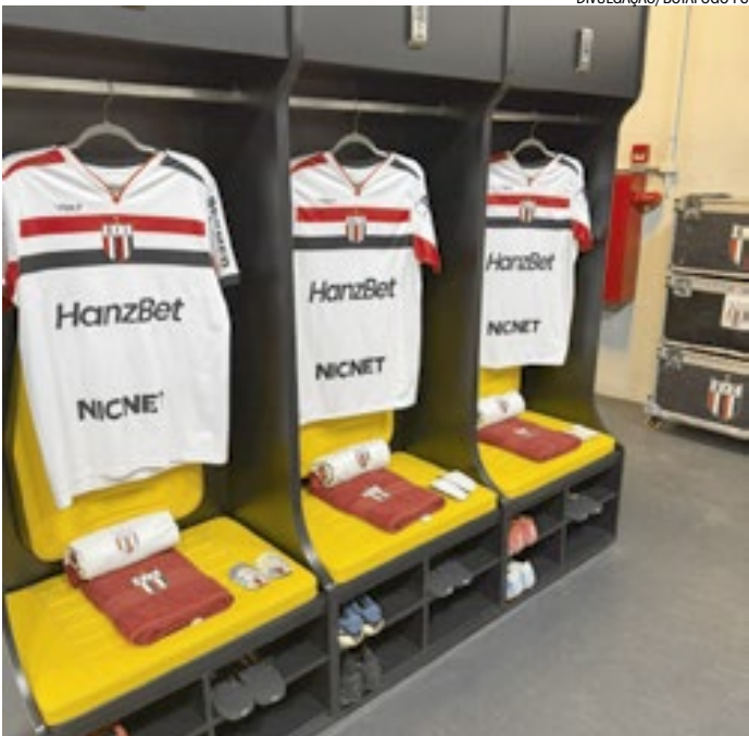
Vestiário do Botafogo, no estádio Santa Cruz: ver o tricolor em ação contra o Palmeiras vai custar caro para as duas torcidas