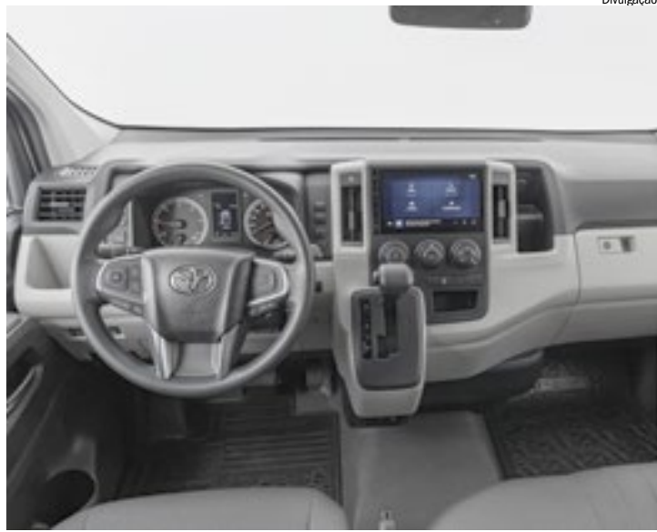
Painel foi desenvolvido para facilitar o dia a dia de quem dirige

Toda a estrutura da nova Hiace Furgão foi projetada para oferecer o máximo em segurança, com zonas de absorção de impacto e reforços em formato ring frame ao longo da carroceria. O modelo traz cintos de segurança de três pontos para todos os ocupantes e três airbags (duplos frontais e