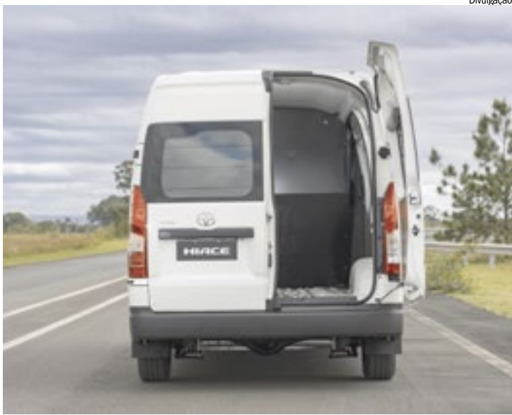
Modelo tem capacidade para transportar até 1.055 kg