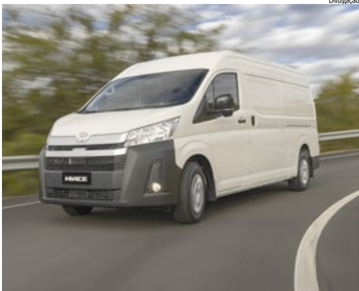
Furgão traz o consagrado conjunto mecânico da caminhonete Hilux

Todo o painel foi desenvolvido para facilitar o dia a dia de quem dirige, com inclinação pensada para ampliar a visibilidade e a sensação de espaço. Nesse sentido, o quadro de instrumentos e a central multimídia de 9 polegadas foram posicionados em local elevado, melhorando a ergonomia e liberando mais espaço para os ocupantes da primeira fileira. E, quando não utilizado, o encosto central pode ser rebatido para dar lugar a um amplo console com porta-copos e mesa de apoio.