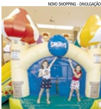
NOVO SHOPPING - DIVULGAÇÃO

As férias escolares ganham mais diversão com a chegada do Parque dos Smurfs ao Novo Shopping. Instalado na praça de eventos, o espaço oferece piscina de bolinhas, escorregadores, brinquedos infláveis e obstáculos interativos, além de áreas para fotos em família. Inspirada nos personagens clássicos, a atração conecta gerações ao unir a memória afetiva dos adultos ao encantamento das crianças. Os ingressos variam conforme o tempo de permanência e o parque conta com monitoria compartilhada, regras de acessibilidade e benefícios para públicos específicos.