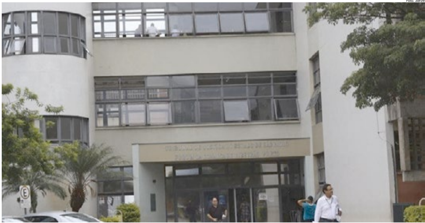
Forum de Ribeirão Preto: Justiça da cidade anulou contrato de empréstimo consignado feito em benefício de menor; abaixo, demonstrativo de descontos

“Ai procurei um advogado que eu conhecia e perguntei se era verdade. Ele fez a ação e suspenderam o empréstimos em menos de duas semanas”, contou. “Agora o processo vai continuar e espero conseguir a decisão favorável”, conta ela. O pedido do advogado