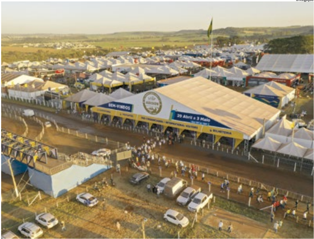
Primeiro lote de entradas, com preço promocional, está disponível até o dia 22 de fevereiro

De acordo com a organização, o segundo lote será