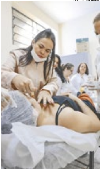
Cursos profissionalizantes s o gratuitos

Mais informa  es podem ser obtidas pelo telefone (16) 98161-6785.