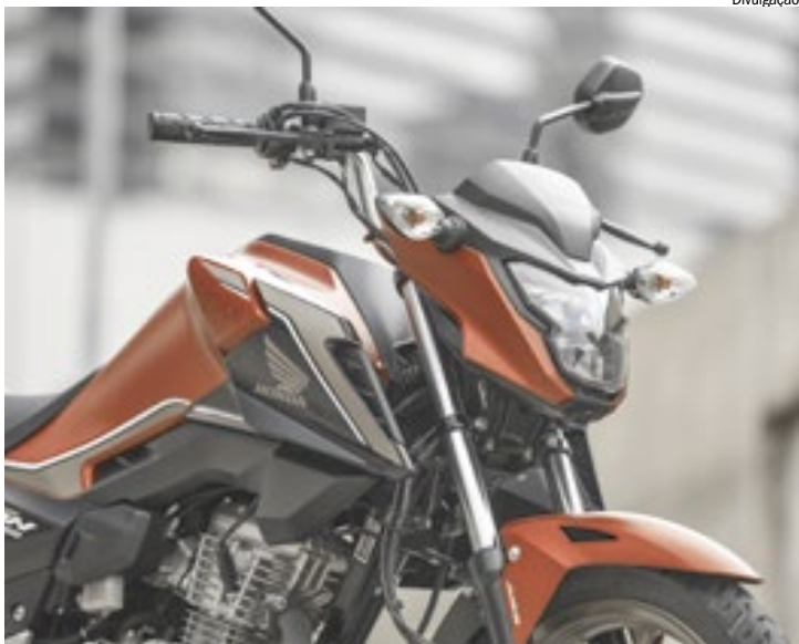
Modelo tem um histórico bem-sucedido de edições especiais

na fábrica de Manaus, AM, tem um bem sucedido histórico de versões comemorativas em edição limitada, que justamente são considerados marcos da história do modelo e disputadíssimos pelos fãs da marca.