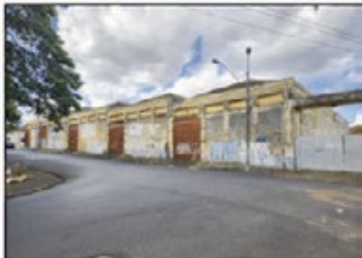
Galpões Assed, na rua André Rebouças, no Ipiranga: disputa judicial