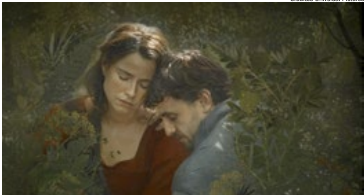
Filme Hamnet A Vida Antes de Hamlet

Inspirado no romance de Maggie O’Farrell, Hamnet: A Vida Antes de Hamlet revisita a vida íntima de William Shakespeare a partir da perda de seu filho de 11 anos, em um drama sensível protagonizado por Paul Mescal e Jessie Buckley. Já Marty Supreme acompanha a trajetória improvável de