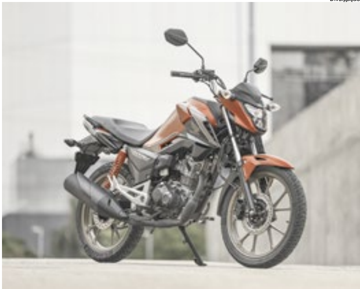
Edição celebra o cinquentenário da moto mais vendida do Brasil

A Honda CG, assim como outros modelos produzidos