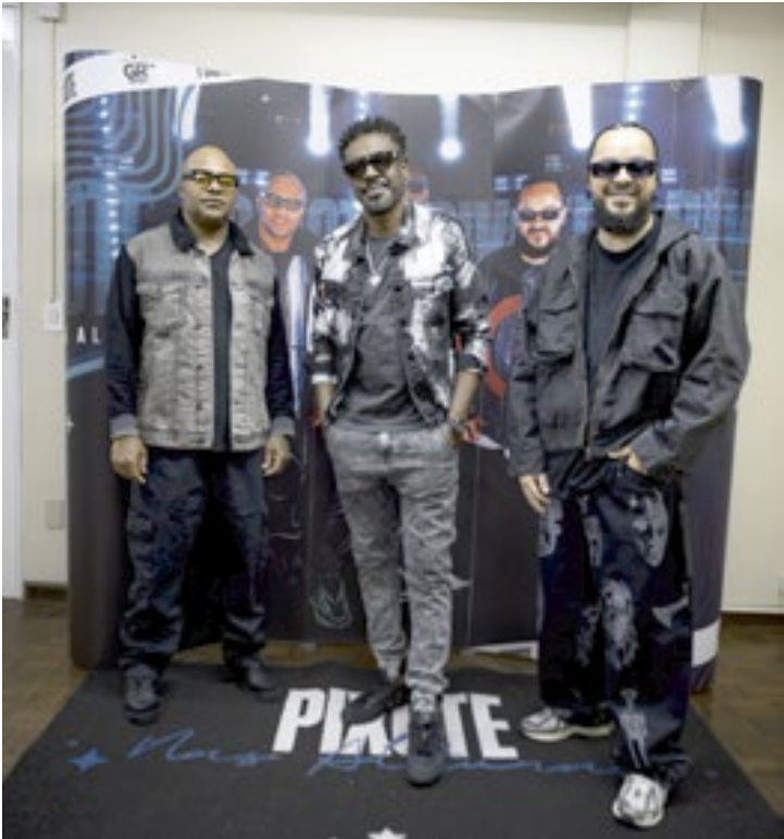
Fundado nos anos 90, grupo Pixote vive um novo auge no pagode

PIXOTE E TIEE Local: Restaurante Fazendinha Data: 17/01 Ingressos: Guicheweb