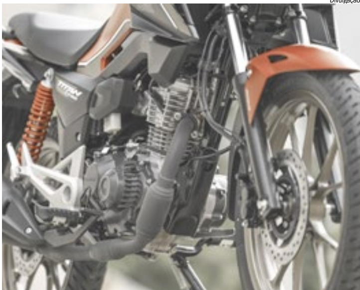
CG 160 Titan será produzido em exclusiva cor vermelha