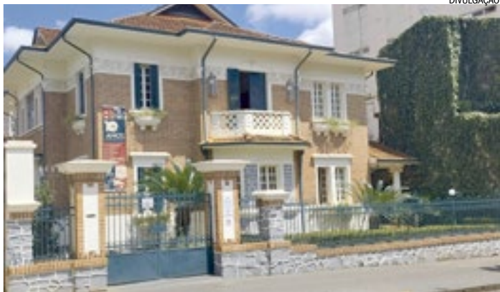
Fachada do Museu da Memória Italiana