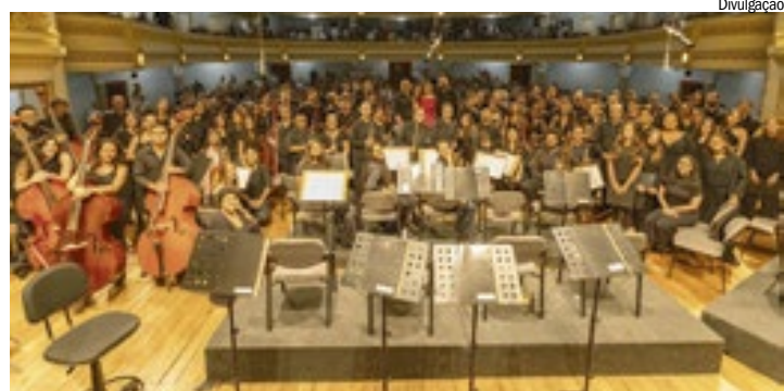
Para os interessados em conhecimento musical, a seleção busca jovens que queiram estudar canto ou aprender a tocar instrumentos

Na área de Música, há vagas para instrumentos como viola, contrabaixo acústico, clarinete, percussão e piano, além de canto lírico, Banda Sinfônica e diferentes formações de canto coral (infantil, juvenil e adulto). Para a maioria das modalidades, a seleção será feita por meio do envio de um vídeo de até três minutos, no qual o candidato deve executar uma peça livre e demonstrar suas habilidades técnicas. Os vídeos devem ser enviados até 1º de fevereiro, conforme orientações