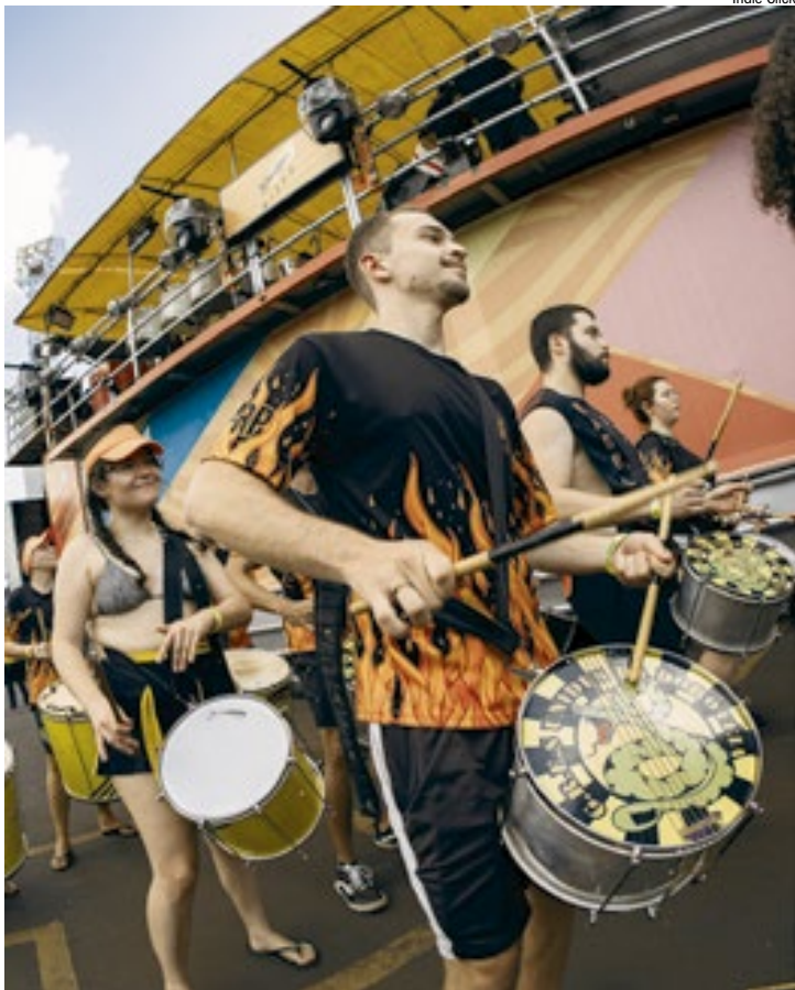
Bateria Maculosa, da USP, é uma das atrações do bloco