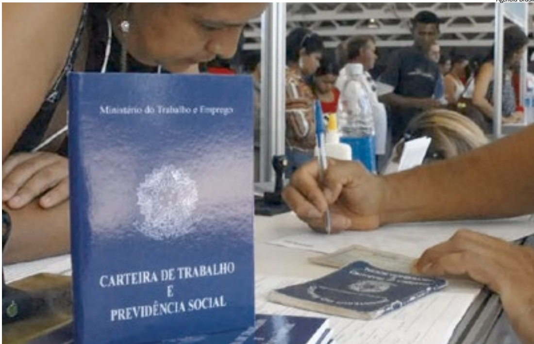
Ribeirão teve registro de ampliação vagas no mercado formal: comércio e serviços lideraram bom desempenho

Em comparação com municípios de porte populacional semelhante ao de Ribeirão Preto, o desempenho se mostra relevante. A cidade gerou 4.817 empregos formais a mais que Santo André, a quinta mais populosa do Estado de São Paulo, com 782.048 habitantes. O