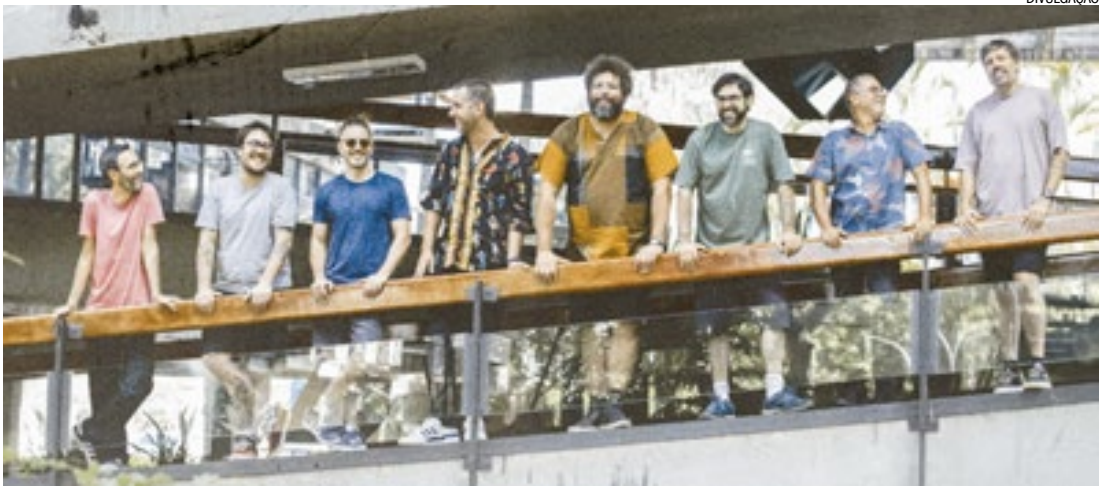
Banda traz para Ribeirão um show de sua turnê de reencontro