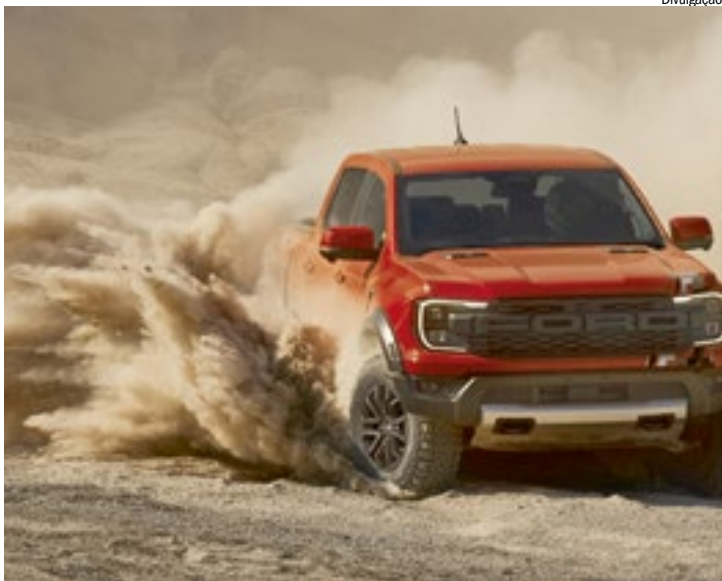
Ford Ranger Raptor foi destaque nas vendas em 2025

A Ford anunciou também um aporte adicional de US$ 170 milhões para produzir a Ranger Híbrida Plug-in, que será lançada em 2027 com motor flex, desenvolvido pela engenharia da marca no Brasil. Com isso,