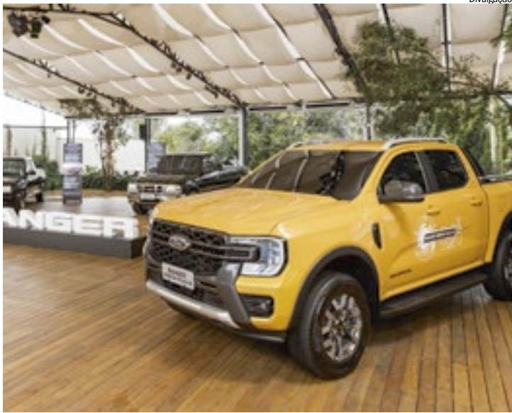
Ford Ranger Híbrida Plug-in é uma das apostas da montadora