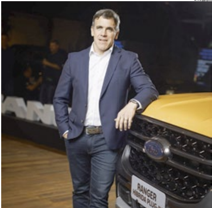
Martín Galdeano, presidente Ford na América do Sul

A fábrica de Pacheco, na Argentina, iniciou a produção do motor Panther 2.0 na mesma linha do Lion V6 3.0 e recebeu um investimento de US$ 40 milhões para a ampliação da capacidade de produção da Ranger, elevada a 80.000 unidades anuais – um novo recorde histórico, 30% superior a 2024.