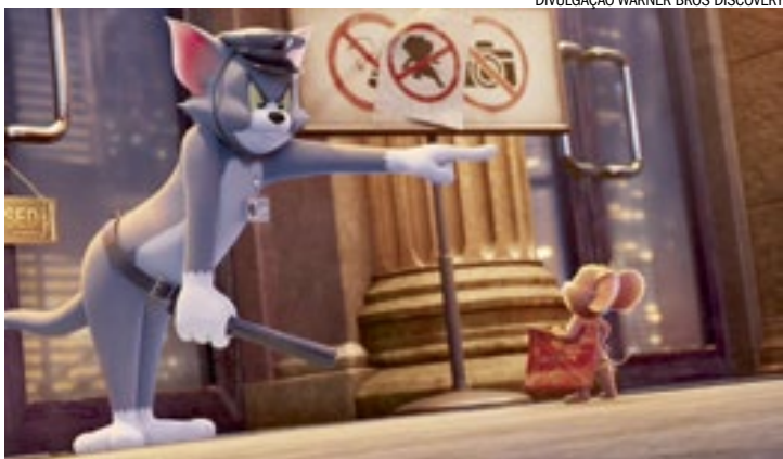
Tom & Jerry viajam no tempo em Uma Aventura no Museu

Para o público infantil e famílias, Tom & Jerry: Uma Aventura no Museu traz de volta a clássica rivalidade do