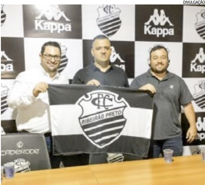
Kappa é a nova fornecedora de material esportivo do Comercial