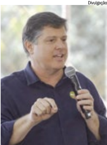
Baleia Rossi (MDB)

O Brasil real não está nos gabinetes de Brasília, ele pulsa nas nossas cidades. É nelas que as pessoas buscam saúde, educação e trabalho. No entanto, vivemos uma injustiça histórica: enquanto o governo federal retém 50% de tudo o que é arrecadado, os municípios, que carregam o peso do dia a dia, ficam com apenas 22%. Essa concentração de poder e dinheiro na capital federal é o que trava o nosso desenvolvimento. Minha trajetória em Ribeirão Preto provou que a gestão técnica e o apoio ao agro são os motores da prosperidade. Fizemos da nossa cidade uma das três melhores do país, local de desenvolvimento socioeconômico. Mas agora, o desafio é maior. Defender o municipalismo é defender que o imposto pago pelo cidadão retorne para onde ele vive. Precisamos de uma representação que entenda de gestão pública, que tenha coragem para combater a corrupção que destrói resultados e que garanta segurança jurídica para quem produz. Minha bandeira é a descentralização: menos Brasília e mais Brasil. É hora de levar à Câmara Federal a eficiência que testamos e aprovamos na prática, construindo um país onde as oportunidades cheguem a cada uma das cidades brasileiras.