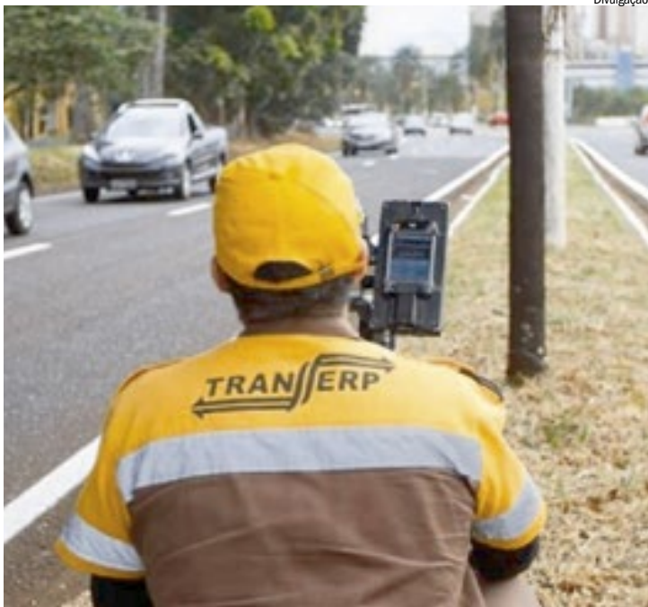
Agentes da MP Mobi durante fiscalização com radar móvel em Ribeirão