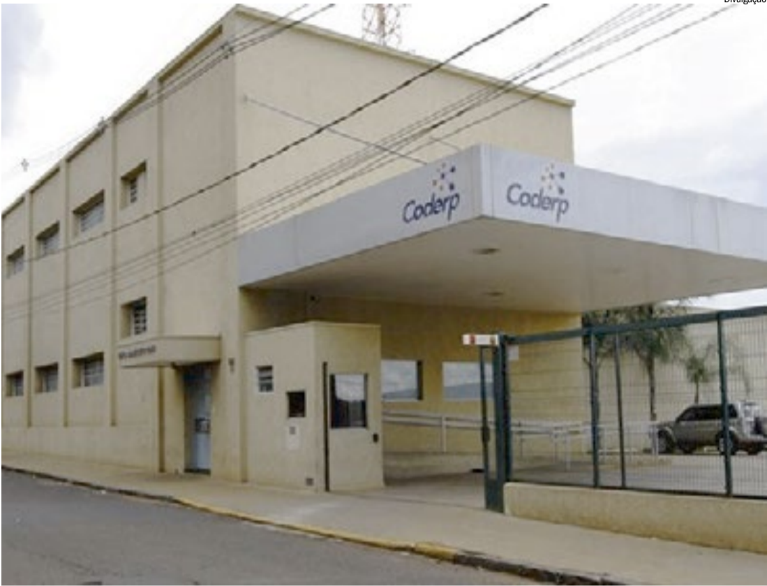
Sede da Coderp, na área Central de Ribeirão Preto, chegou a ser penhorada para pagar dívidas

O projeto foi aprovado em regime de urgência pelos parlamentares e deve ser sancionado nos próximos dias para permitir a homologação do acordo judicial entre a Coderp e o credor.