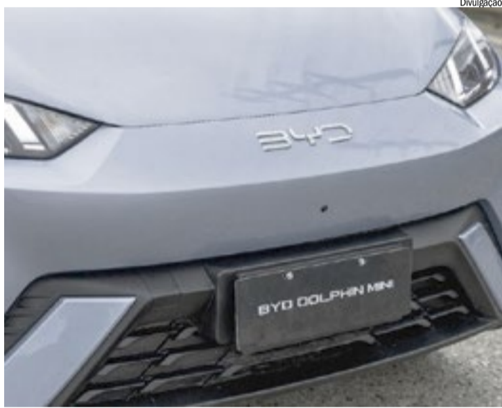
Dolphin Mini é o 1º carro elétrico a alcançar 50 mil unidades vendidas