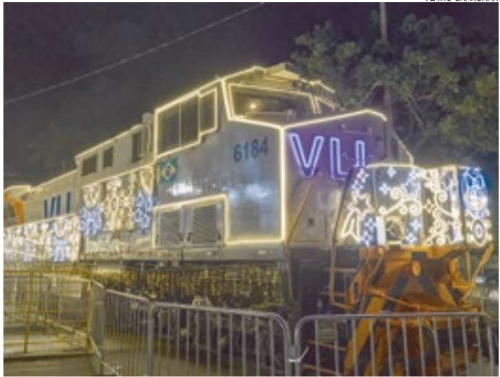
A locomotiva iluminada da VLI leva Papai Noel e programação artística a comunidades próximas à ferrovia