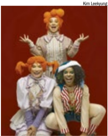
Espetáculo “Toda Mãe é Noel” celebra afeto e tradição natalina em narrativa sensível para toda a família

O espetáculo “Toda Mãe é Noel”, da Cia. Guarda Chuva, apresenta a história sensível de uma mãe costureira que dedica o Natal à criação de uma boneca feita à mão para a filha. Com músicas autorais e sonoplastia ao vivo, a montagem celebra afeto, memória e a força materna na construção da magia natalina. A companhia, premiada em diversos festivais, traz ao palco um olhar poético e afetivo sobre o cotidiano das famílias brasileiras.