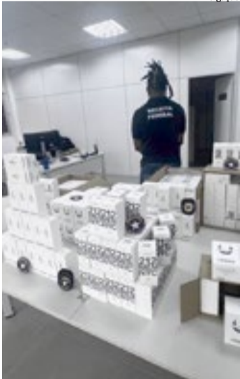
Lote de perfume apreendido pela Receita Federal em Ribeirão Preto

ta Federal alerta que essa prática gera concorrência desleal, prejudicando o comércio formal e causando distorções no mercado de trabalho.