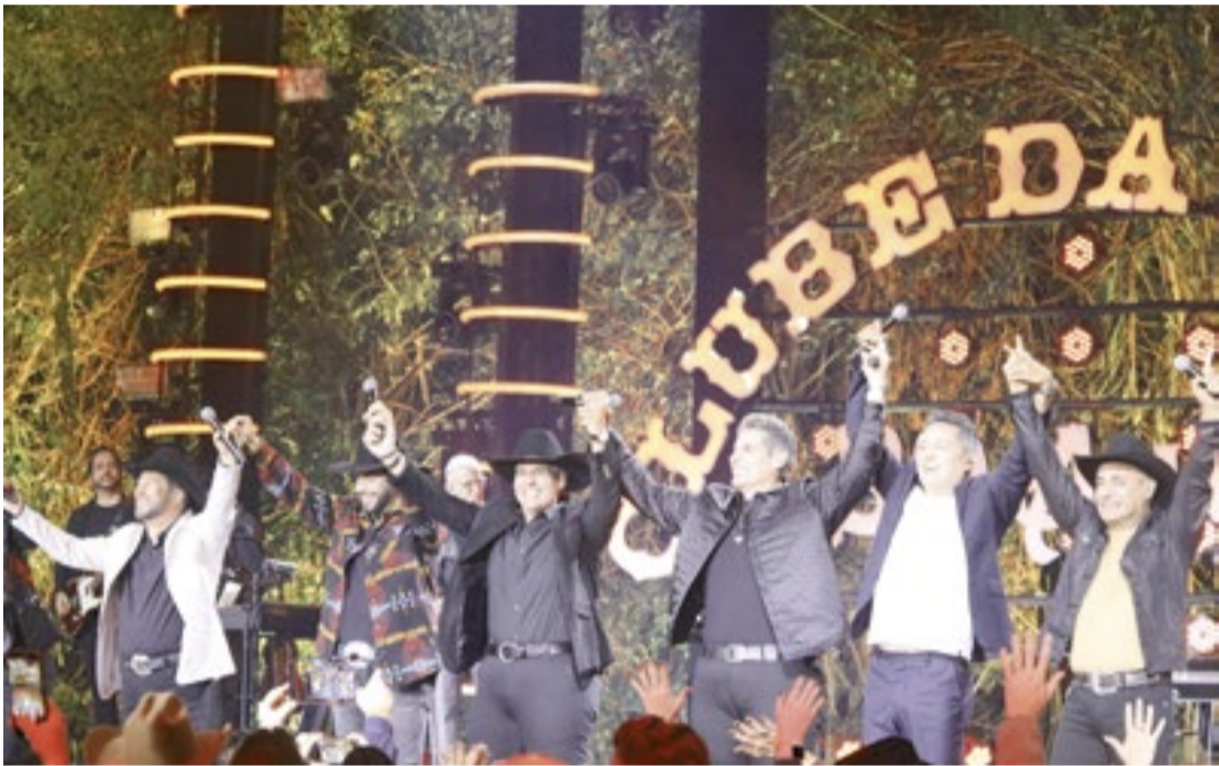
Duplas do Clube da Viola vão se apresentar no evento de lançamento do projeto audiovisual gravado este ano

Evento na Fazendinha marca a nova fase do projeto sertanejo iniciado em Ribeirão, e que completa 30 anos de trajetória em todo o país