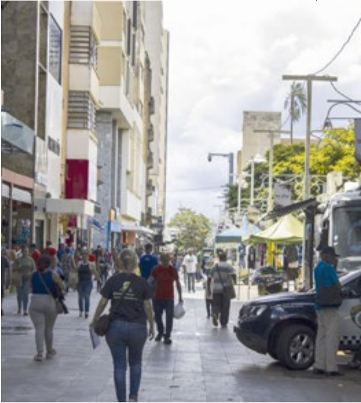
Movimento no comércio no calçadão da área central em Ribeirão