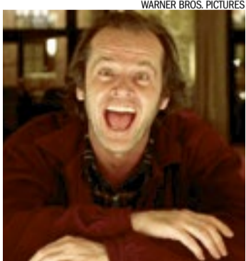
O pesadelo retorna às telonas: relançamento de “O Iluminado” celebra 45 anos do clássico