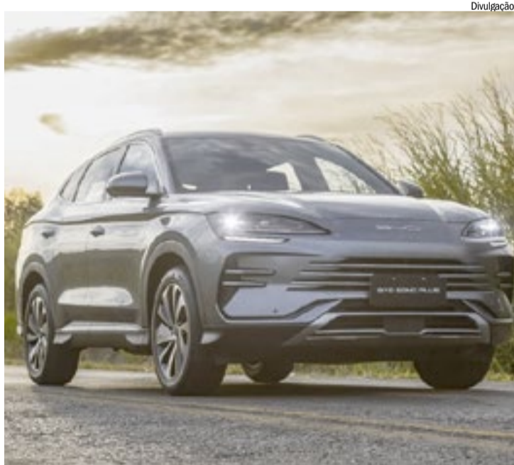
Companhia bate recorde em novembro com mais de 16.500 pedidos

pliando nossa presença industrial e construindo, junto com os brasileiros, um futuro mais limpo, mais tecnológico e verdadeiramente sustentável. E seguimos, porque o melhor ainda está por vir”, completa Tyler Li, presidente da BYD Brasil.