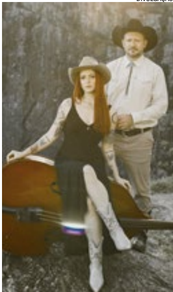
No Palco Vibe, o duo Sweetgrass & Steel retorna ao IPA Day Brasil com folk e country que harmonizam com as IPAs mais leves do festival

Além da variedade sensorial, o festival aposta em uma experiência musical alinhada ao perfil das cervejas. Serão três palcos com propostas distintas, onde ritmos leves, intermediários e intensos harmonizam com IPAs de diferentes teores alcoólicos. No Palco Vibe, a banda Sweetgrass & Steel — destaque no IPA Day SP e queridinha do público — integra a ala das atrações de-