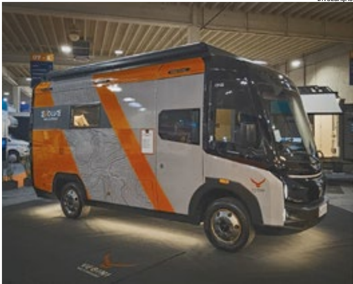
Motor elétrico de 183 cv entrega torque máximo de 350 Nm

O valor do veículo varia entre R$ 1,3 e R$ 1,4 milhão, de acordo com as configurações escolhidas pelo comprador.