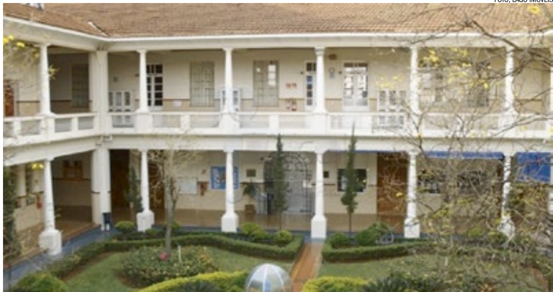
Vista interna do Colégio Marista, próximo à região central da cidade