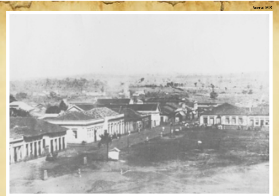
PRIMEIRA MATRIZ - Largo da Igreja Matriz, onde foi erguida a primeira categral da cidade, em foto datada de 1890. Localizado entre as ruas General Osório e Álvares Cabral, local ocupado hoje pela Praça XV de Novembro e Fonte Luminosa, o espaço abrigou a primeira igreja da cidade, demolida em 1905, sendo a mesma transferida para o atual espaço da Catedral, em frente à Praça das Bandeiras.