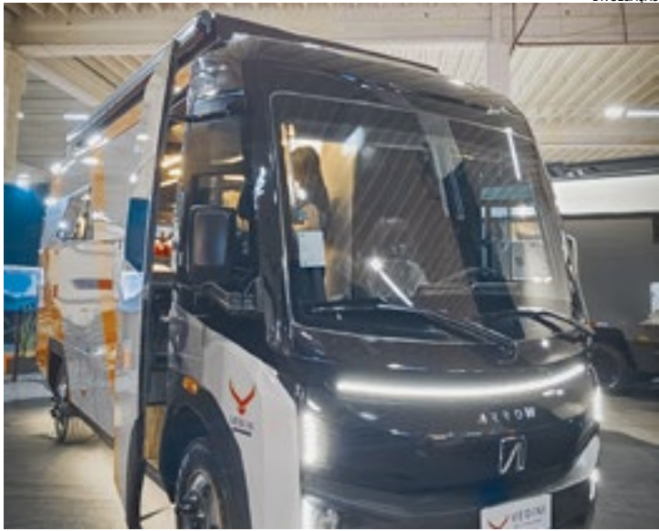
Arrow One é o primeiro motorhome 100% elétrico da América Latina