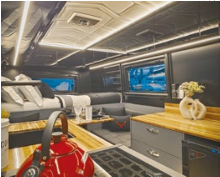
Imagens do interior do veículo, divulgadas pela fabricante